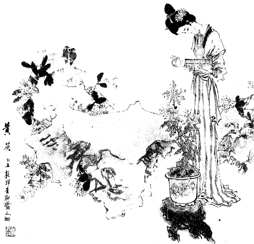
4. 黄 英