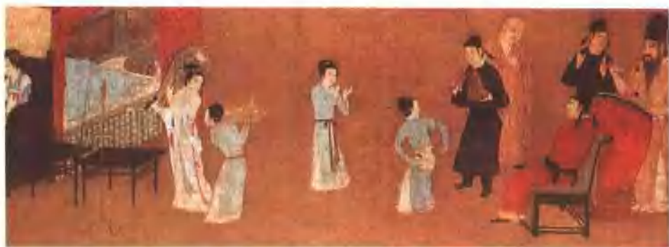
五代 韓熙載《夜宴圖》中樂鼓伴舞狀