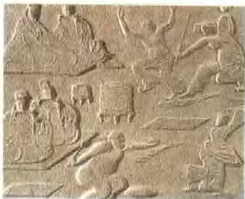
東漢舞樂雜技畫像碑