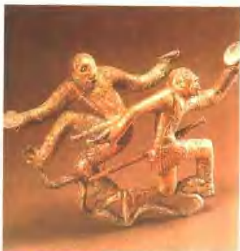
滇人舞樂表演青銅扣節