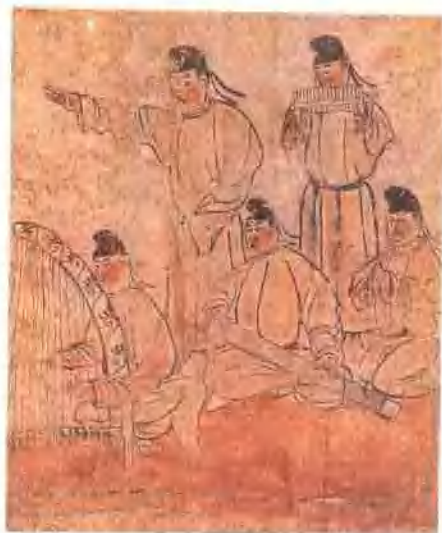
唐 蘇思勗墓舞樂壁畫