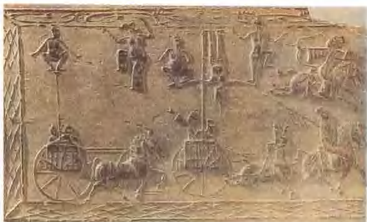
漢舞樂百戲空心磚