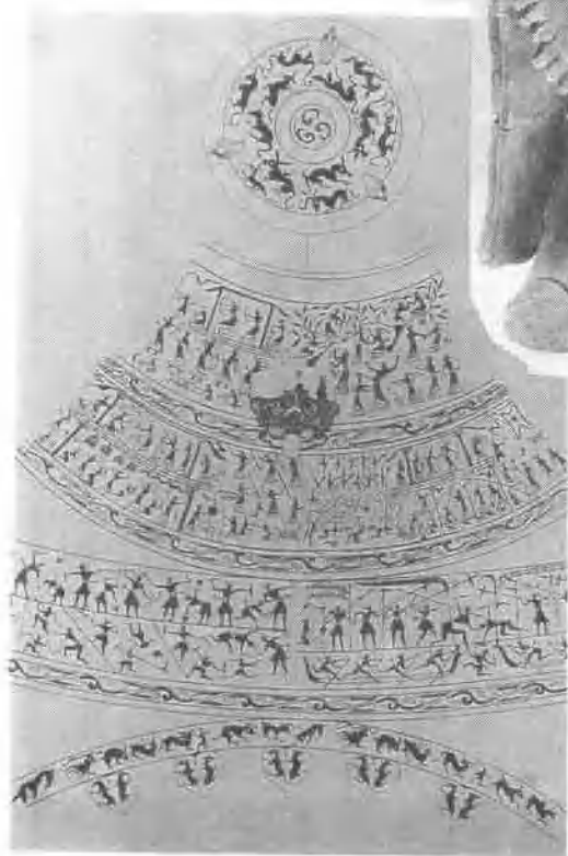
戰國宴樂攻戰紋銅壺及紋樣展開圖