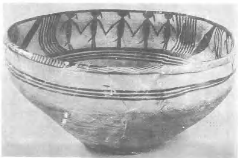
新石器時代舞蹈紋彩陶盆