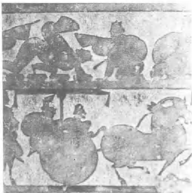
東漢武梁祠漢畫像石中的鼓舞