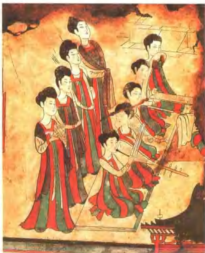
唐 李壽墓壁畫女樂部份