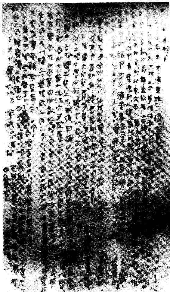
图一 帛书 五十二病方（部分）