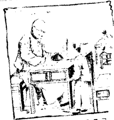
第二册 第四期 月刊 小

鲁迅先生有句名言，说“三言两语，道尽人生”。这话说得真妙。他在这两本书里，把人生看得透透的。《斯巴达之魂》讲的是古希腊斯巴达人的故事，他们为了自由和荣誉，不惜牺牲生命。鲁迅先生用这个故事来激励中国人，要他们像斯巴达人一样，有骨气，有勇气。《怀旧》则是鲁迅先生回忆自己小时候的生活，写得很真实，很感人。他写到了家乡的景色，写到了家乡的亲人，写到了自己的成长经历。这两本书都是鲁迅先生的代表作，也是他留给我们的宝贵财富。