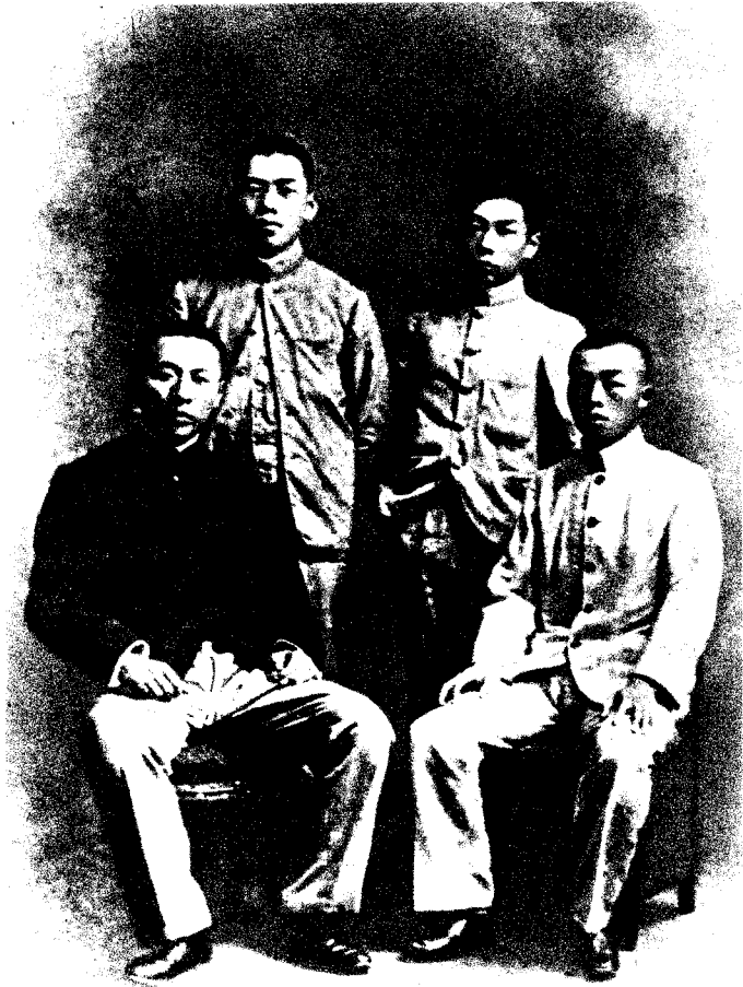
在日本时与绍兴籍同学合影（1904）