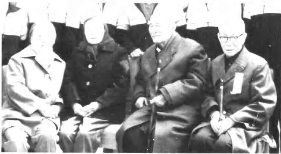
1987年4月26日，清华园未名湖畔朱自清先生石像揭幕典礼上，作者与朱自清先生夫人(左二)和吕叔湘先生夫妇合影。