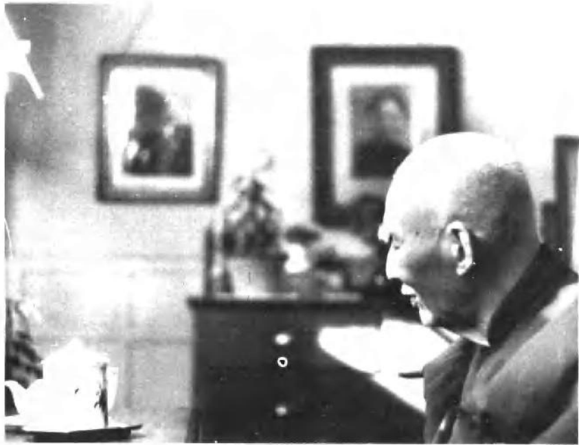
1987年11月4日摄于作者卧室中。