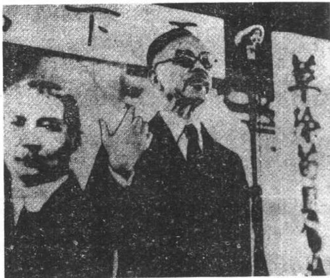
陳嘉庚在南洋華僑籌賑會上發表演說