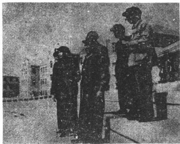
陳嘉庚視察廈門大學建築工程