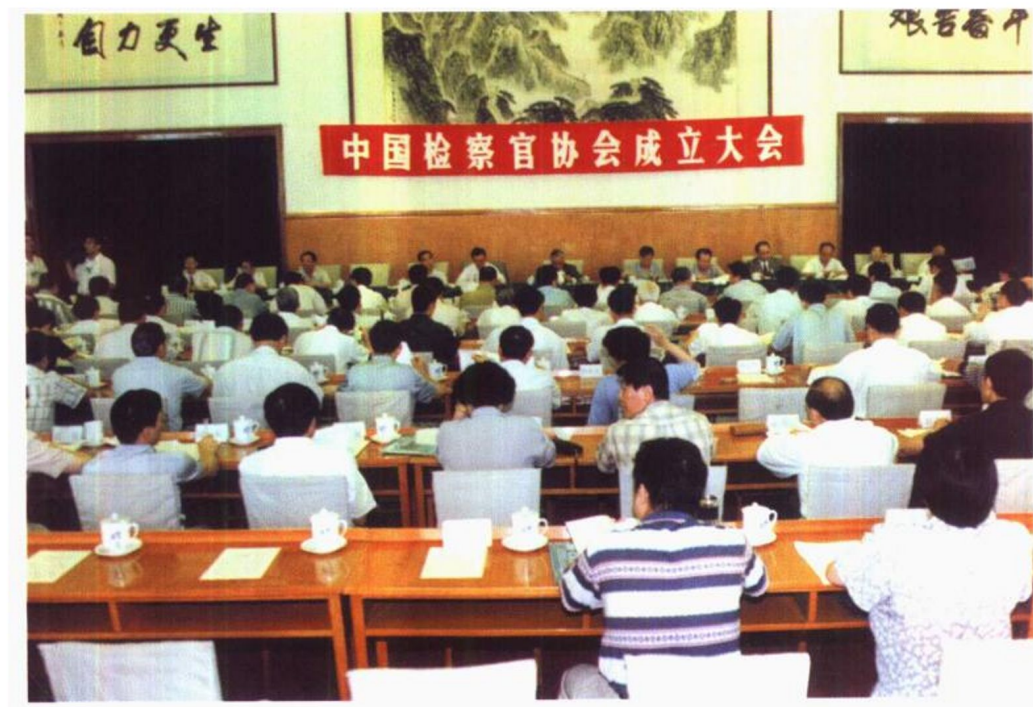
1996年7月12日，中国检察官协会成立大会在北京召开。