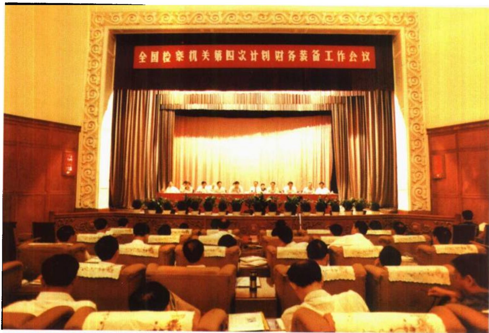
1996年7月25日至28日，全国检察机关第四次计划财务装备工作会议在长春召开。