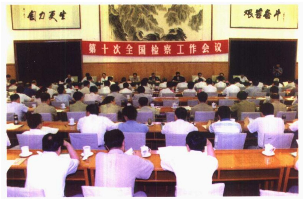
1996年7月8日至12日，第十次全国检察工作会议在北京召开。