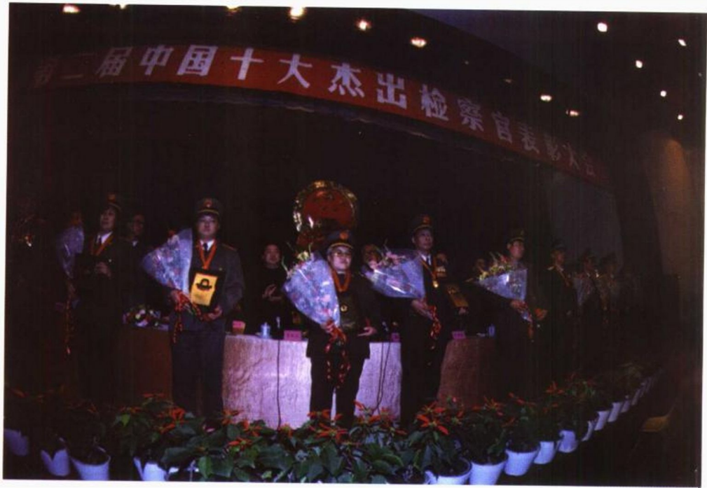
1996年12月6日，第二届十大杰出检察官表彰大会在北京举行。