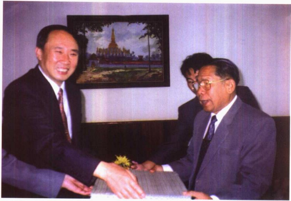
1996年4月18日至25日，最高人民检察院副检察长赵虹率中国检察代表团访问老挝。图为赵虹副检察长会见老挝国会主席沙曼·维亚吉。