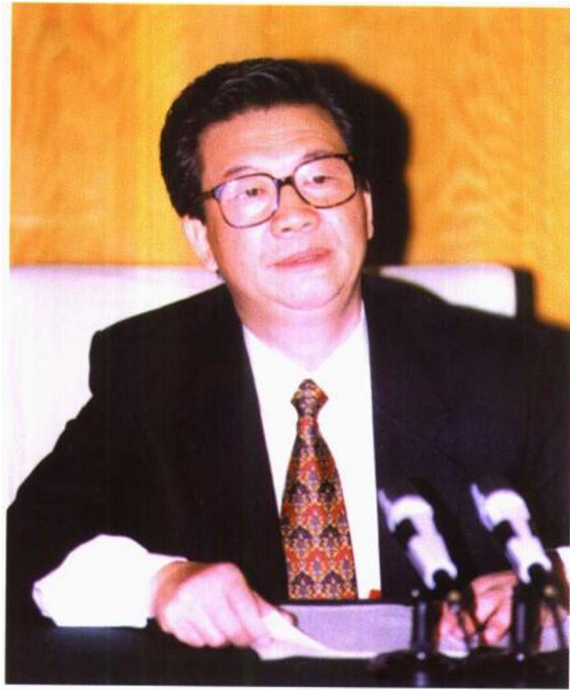
1996年7月12日，最高人民检察院副检察长梁国庆在第十次全国检察工作会议上作总结讲话。