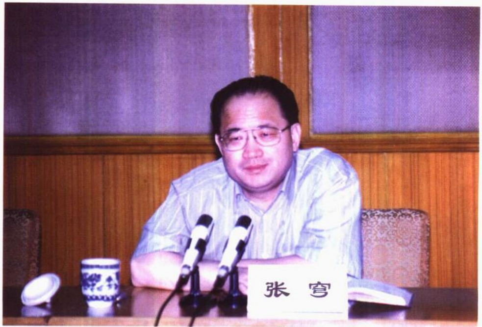
1996年6月3日，最高人民检察院副检察长张穹在全国检察机关研究室工作会议上讲话。