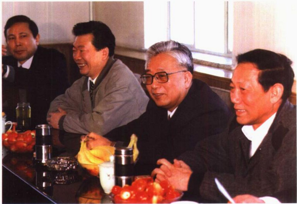
1996年4月18日，最高人民检察院检察长张思卿（上图右一，下图右二）到北京郊区调查研究指导工作。最高人民检察院副检察长梁国庆（上图左一，下图左二）、北京市人民检察院检察长何访拔（上图中，下图右一）陪同视察。