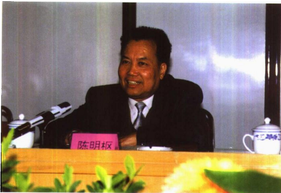
1996年10月28日，最高人民检察院副检察长陈明枢在全国检察机关第三次政治工作会议上讲话。