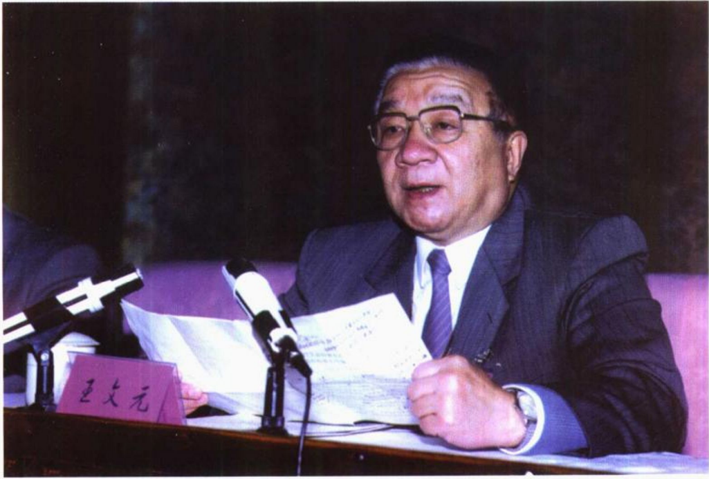
1996年10月20日，最高人民检察院副检察长王文元在全国检察机关第三次监所检察工作会议上讲话。