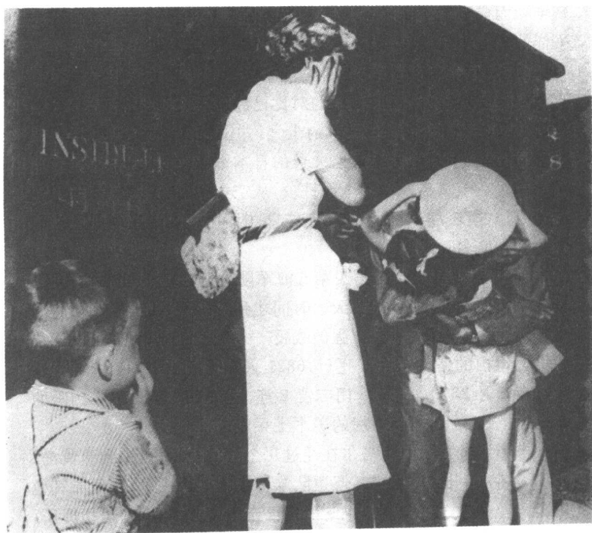
■英雄归来 1944