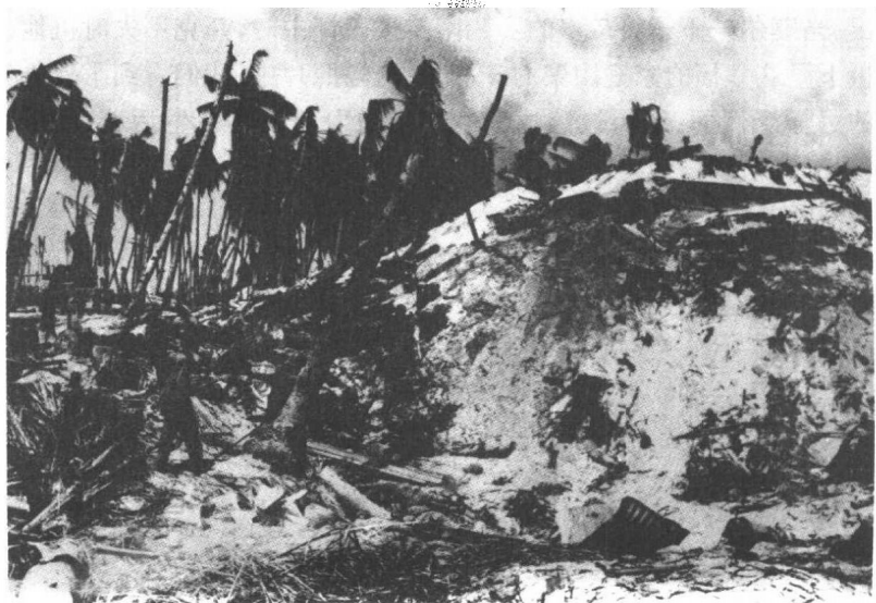
■情愿牺牲 1944

美联社战地摄影记者弗兰克·菲兰随美军先头部队乘船登陆,中途,船被日军击沉。他便扛着沉重的相机和其它摄影器材向岸边泅渡,几经周折,终于在炮火纷飞之中游到岸边。然而,他的相机却受到损毁而无法再用。由于没有相机,他眼睁睁地看着战斗在进行却无法拍摄。他认为这是自己一生中最痛苦的两天。第三天,他借到一台相机,拍下了这历时 76 小时的最后战斗——在地堡中顽抗的 4000 名日军全部被埋葬。