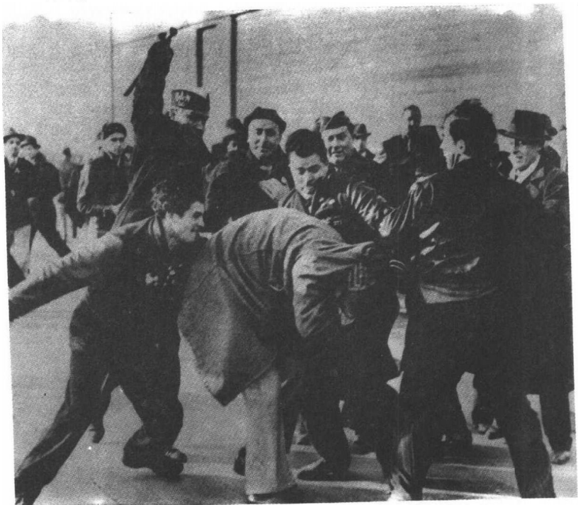
■ 纠察线上的战斗 1942