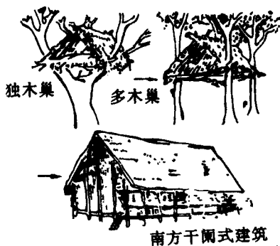
图 2—1 巢居的演变

传说人类的祖先是构巢而居的，即在树木上构筑窝棚（见图 2—1）。“古者禽兽多而人少，于是皆巢居以避之，昼