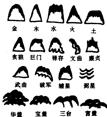
图1—2 五星、九星、三台、华盖等示意图

对山形的吉凶判断还有许多其他方法，如赋予山形以特定的象征——五星说、九星说、三台说、华盖说等等（见图1—2）。五星是指金、木、水、火、土，“金头圆而足阔，木头圆而身直，水头平而生浪如生蛇过水，火头尖而足阔，土