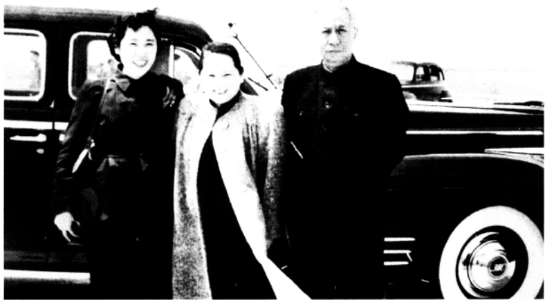
刘少奇、王光美同宋庆龄在上海留影(1957年)