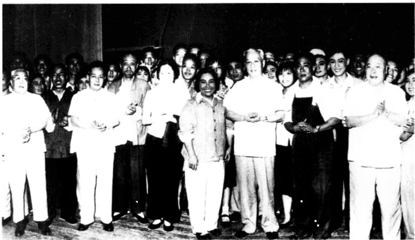
刘少奇观看淮剧《海港的早晨》后与演员合影留念(1964年)