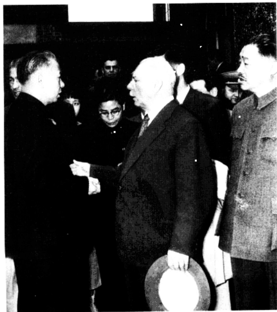
刘少奇陪同苏联贵宾在上海瞻仰孙中山故居(一九五七年)