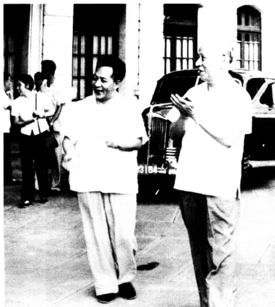
刘少奇视察上海（一九六四年） 徐大刚供稿