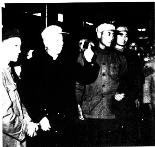
刘少奇视察上钢二厂（一九五八年）