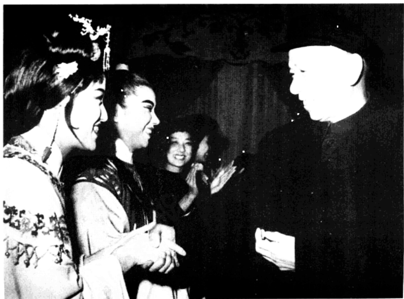
刘少奇祝贺上海越剧团《红楼梦》剧组演出成功(1961年)