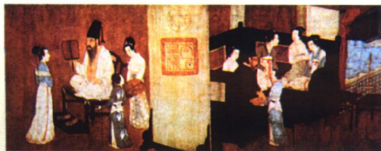
34.《韩熙载夜宴图》(局部)·人物画 顾闳中