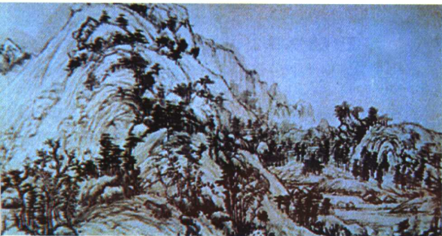
29.《富春山居图》(局部)·山水画 黄公望