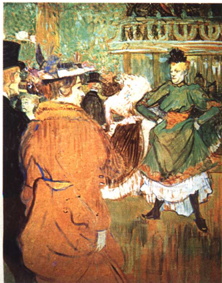
16.《瓜德利尔舞》·印象主义后派作品·油画 劳特累克