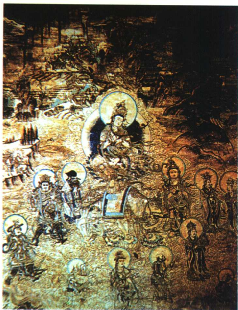
27.《普贤变》·宗教绘画作品（西夏）