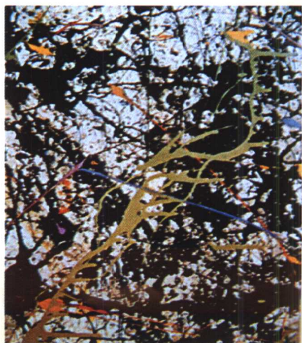
20.《魔鬼》(局部)·抽象表现主义作品·滴漏画 波洛克