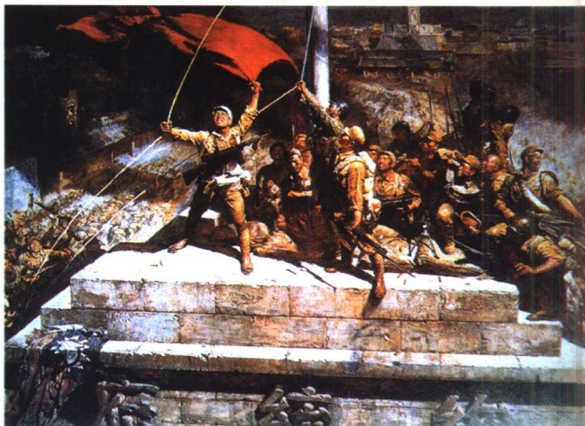
31.《占领总统府》·现实主义绘画作品·油画 陈逸飞、魏景山