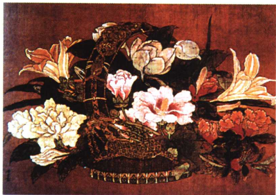
24.《花篮图》·工笔花卉画·李嵩