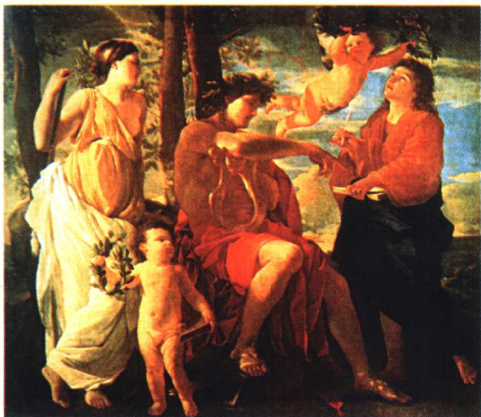
6.《诗人的灵感》·古典主义作品·油画 普桑