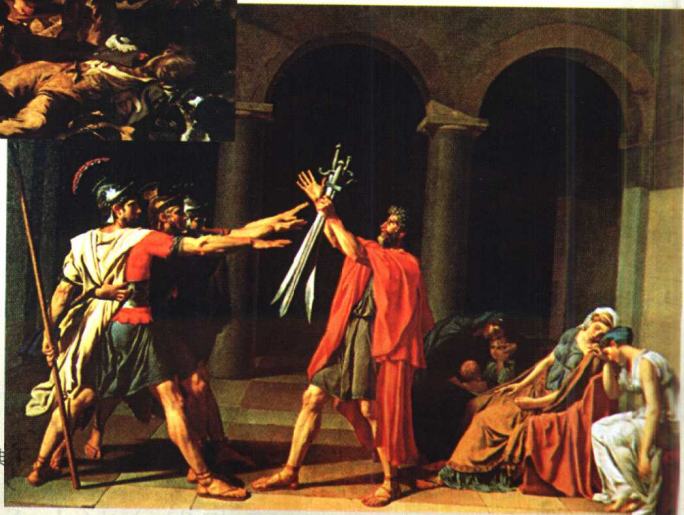
4.《荷拉斯兄弟的宣誓》· 新古典 主义作品· 油画 大卫