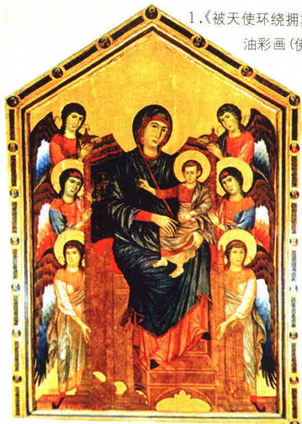
1.《被天使环绕拥戴着的圣母子》· 宗教画· 木板 油彩画(佛罗伦萨)