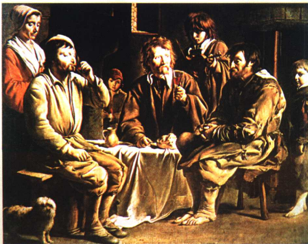
8.《农民进餐》·写实主义作品·油画 路易·勒南