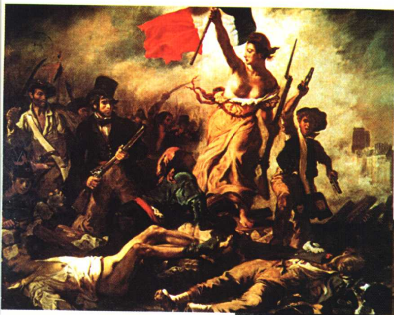
3.《自由引导着人民》· 浪漫主义 作品· 油画 德拉克罗瓦