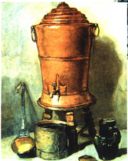
14.《静物》·写实主义作品·油画 夏尔丹