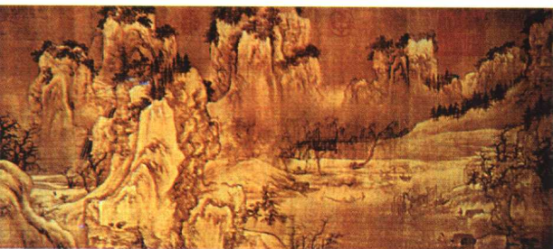
28.《渔村小雪图》(局部)·山水画 王诜