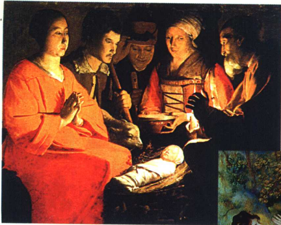
9.《牧人的礼拜》·写实主义作品· 油画 拉图尔