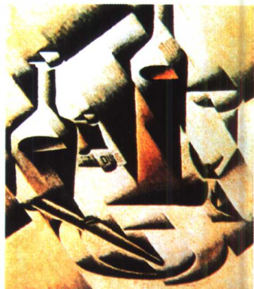
23.《静物》·立体主义作品·油画 格里斯