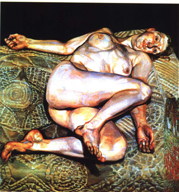
11.《夜之画像》·现代绘画作品·油画 卢·佛洛依德