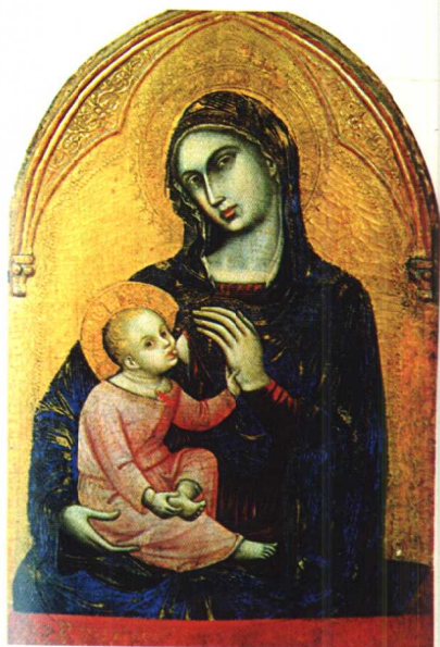
2.《圣母子》· 宗教画· 木板油彩画