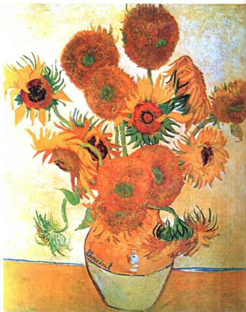
15.《向日葵》·印象主义后派作品·油画 凡·高