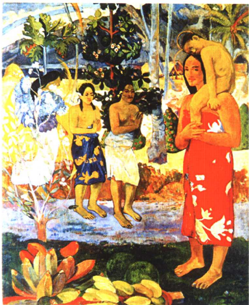
17.《我们朝拜马利亚》·印象主义后派作品·油画 高更