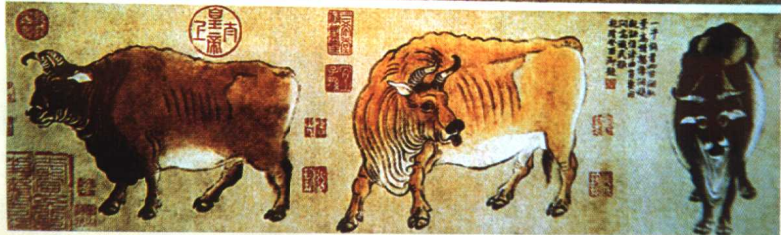
25.《五牛图》·纸本设色·韩滉