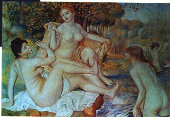
10.《水浴裸女》·印象主义后派作品· 油画 雷诺阿