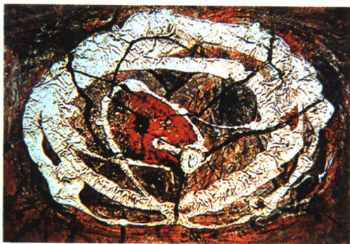
21.《闭路》·抽象主义作品·油画 沃尔斯