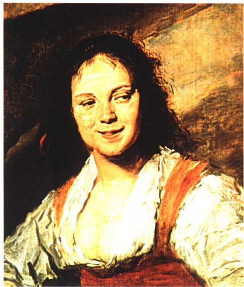
19.《吉普赛女郎》·写实主义作品·油画 弗朗斯·哈尔斯