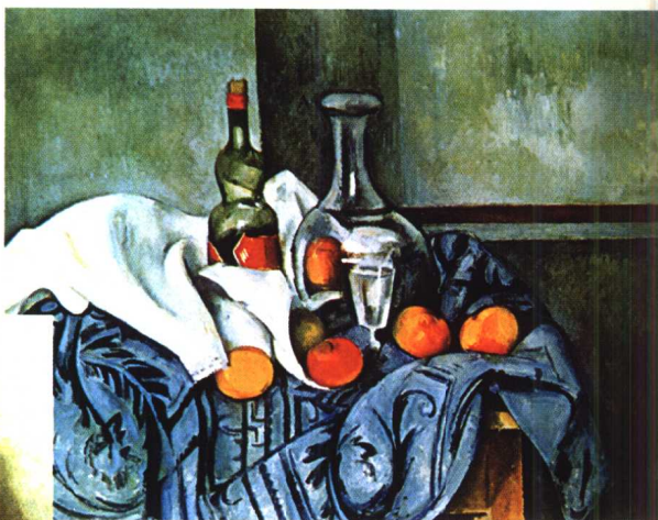
13.《静物》·印象主义后派·油画 塞尚