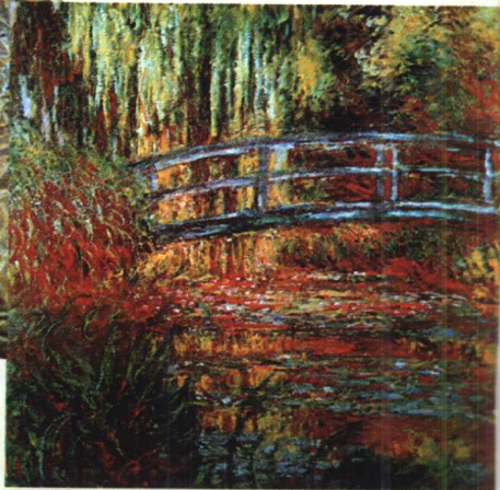
12.《睡莲池》·印象派作品·油画 莫奈