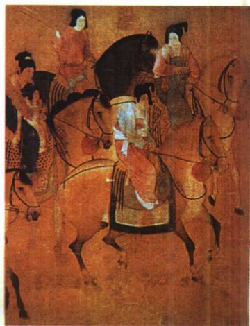
30.《虢国夫人游春图》(局部)·人物画 张萱