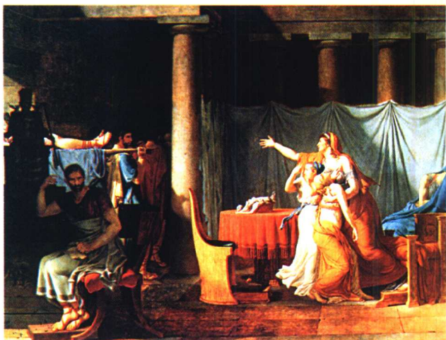
5.《执法吏为布鲁特抬回儿子的尸体》·新古典主义作品·油画 大卫