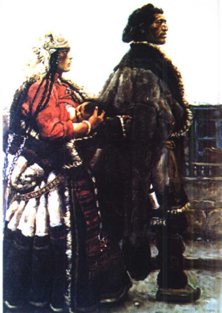
33.《进城》·写实主义作品·油画 陈丹青