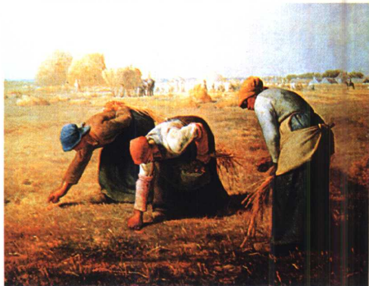
7.《拾穗者》·写实主义作品·油画 米勒