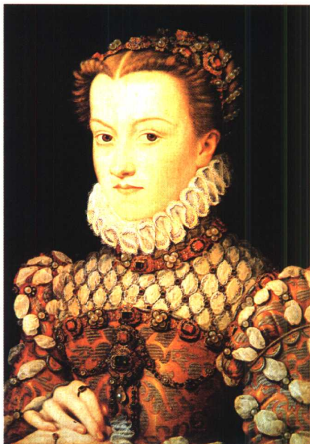
18.《法兰西王后肖像》·写实绘画 作品·木上油画 让·克鲁埃