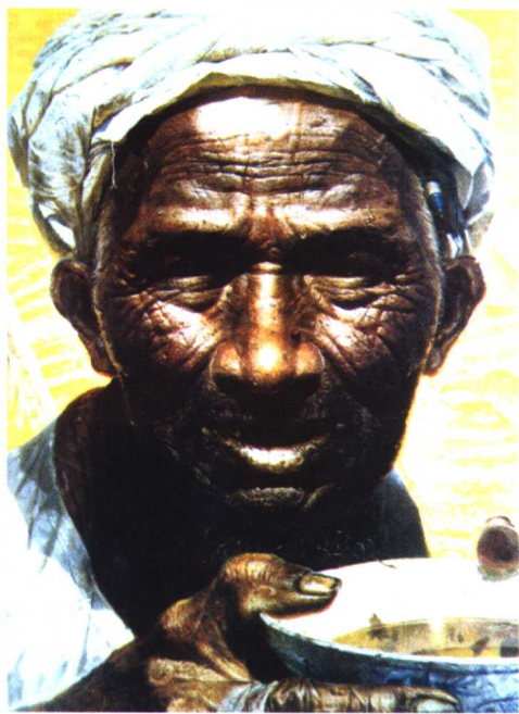
32.《父亲》·超写实绘画作品·油画 罗中立