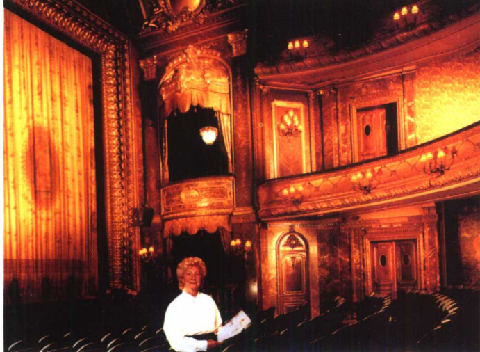
伦敦的“牧羊人市场” ▶