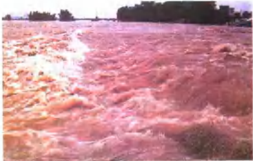
▲ 汹涌的洪水将大堤冲开有一百多米宽的缺口。