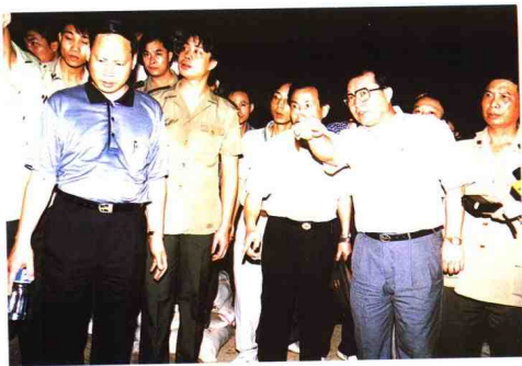
▲ 中共中央政治局委员、省委书记李长春（前右二）在荷村水闸决堤第一线指挥抗洪抢险斗争。