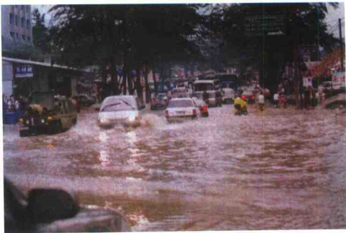
最深达半米多。 区突降暴雨，致使二五国道石油大学门前积水。 ▶1998年4月26日下午5时左右，广州地