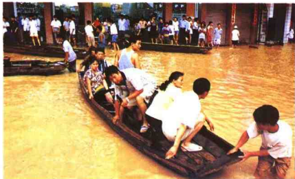
◀五十年一遇的洪水,使阳江市市区顿成一片泽国。

►为了确保灾民在 1999 年元旦前住上新居,阳江市委、市政府和市民政局的领导多次召开重建家园现场会。