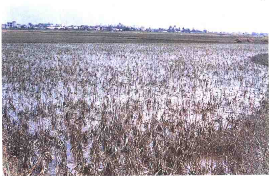
▲ 受台风袭击，湛江市大片粮食作物受损。图为霞山区港南、临海联围，万亩水稻因崩堤被海潮淹死。