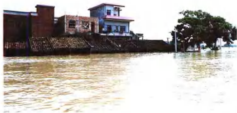
9月16日,汪洋一片的丹灶镇劳边管理区灾情三景。