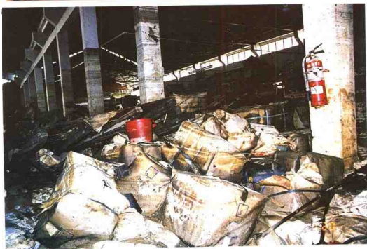
水冲击，损失严重。 ▶ 南海市丹灶镇荷村水闸决堤后，附近厂房受洪