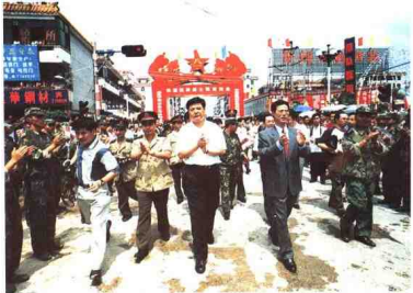
▼广东省委副书记、深圳市委书记张高丽（前右二），深圳市委副书记、市长李子彬（前右三），迎接抗洪勇士凯旋归来。