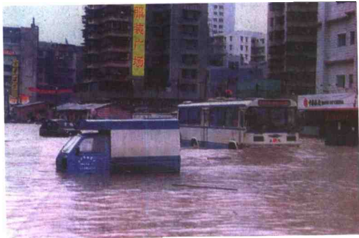
▶1998年5月21日，广州降雨量不大，但由于 下雨时间较长，加上珠江水位较高，达到1.5米，因此 水浸街较多。图为21日上午，先烈东路至沙河大街道 段被水浸没的情景。