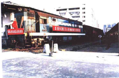
◀满载深圳特区人民深情厚意的赈灾物资专列即将出发。