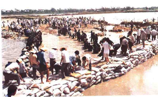
▲ 军民同心及时抢修吴川市张屋堤。