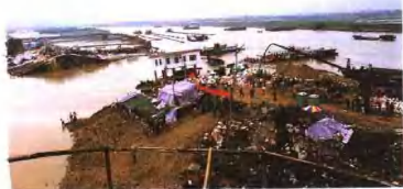
▲ 1998年6月29日晚，南海市丹灶镇荷村水闸决堤。图为决堤现场。