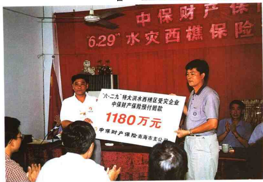
补偿作用。 ◀ 中国人民保险公司广东省分公司积极发挥灾害