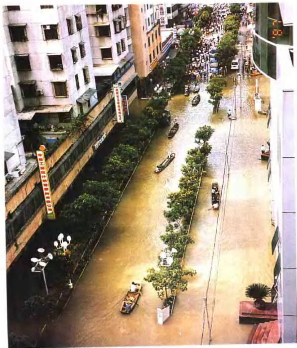
▲ 受洪水影响，丹灶镇街道受浸达数米，街心行舟。