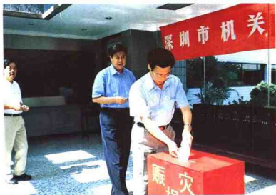
▲广东省委副书记、深圳市委书记张高丽（前一），市委副书记、市长李子彬（前二）带领深圳市五套班子领导向灾区人民捐款。