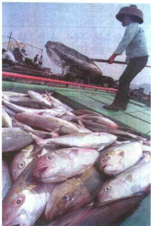
▲ 1998年3、4月，粤东及珠江口附近海域发生赤潮，水产养殖损失严重。图为伤心的渔民不得不将死鱼捞起来。