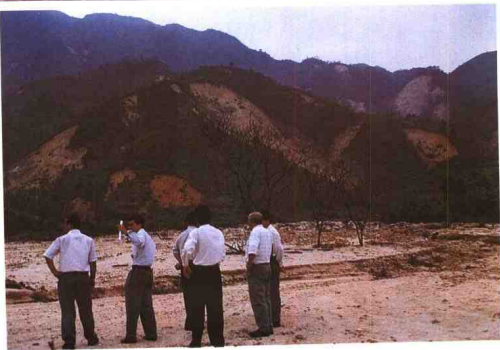
下，阳春市潭水镇发生大规模山崩和泥石流灾害。 ▶1998年6月23日-24日，在大暴雨袭击