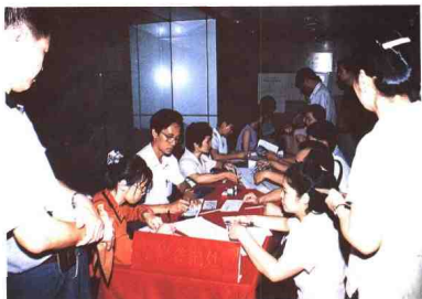
▲深圳市民踊跃向长江灾区捐款