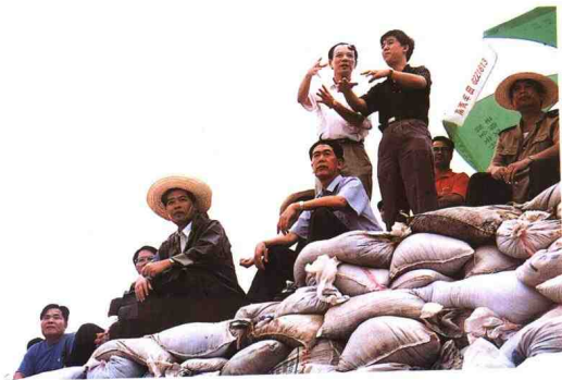
▲ 副省长欧广源在荷村水闸决堤处理现场指挥抢险斗争。