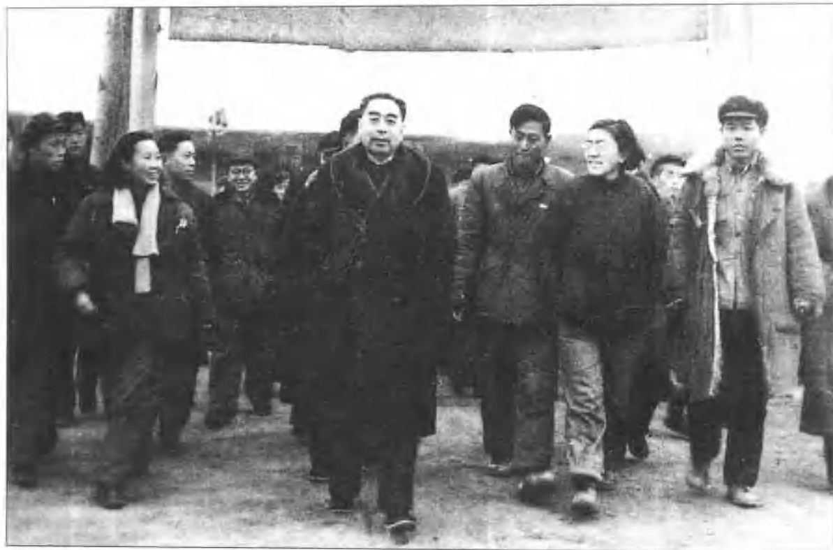
1958年国务院总理周恩来来视察保定