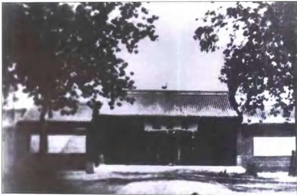
20年代保定军校正门