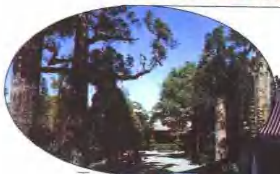
直隶总督署 正门及前院