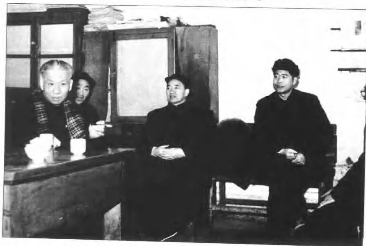
1958年2月全国人大常委会委员长刘少奇视察保定机床厂