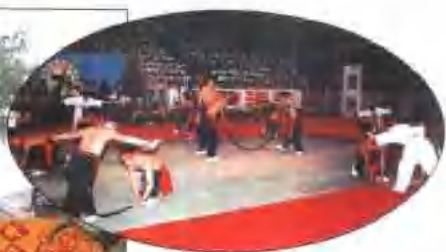
▲气功表演 ◀保定敬老健身节