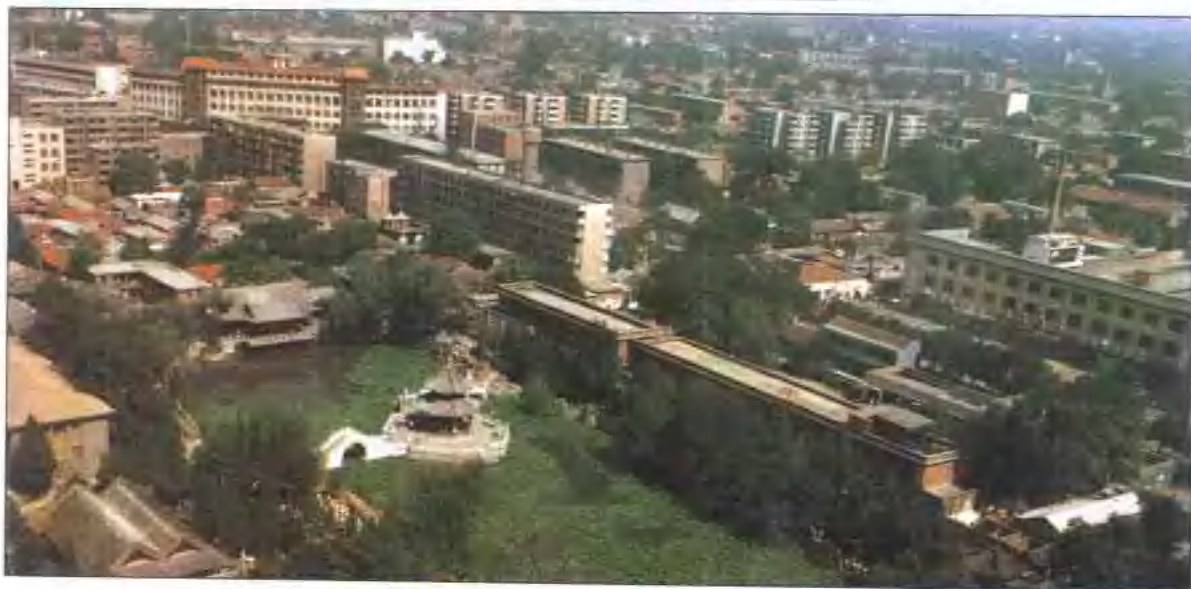
保定市人民政府办公楼(建于1980年)