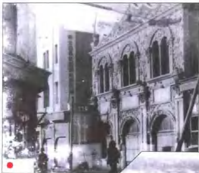
● 50年代保定南大街北口