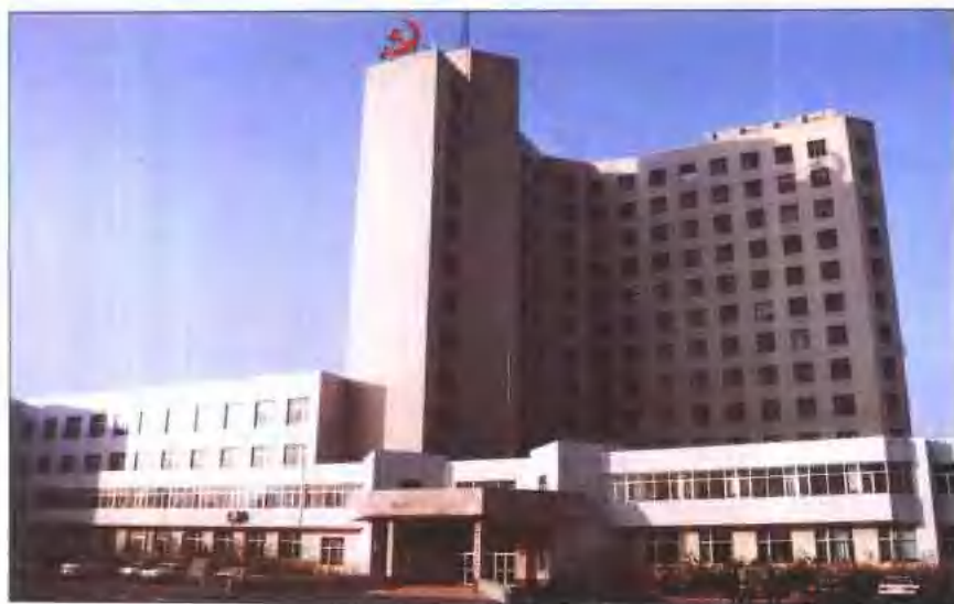
中共保定市委办公楼(建于1990年)