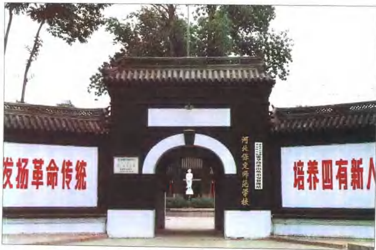
建于20世纪初的保定师范学校