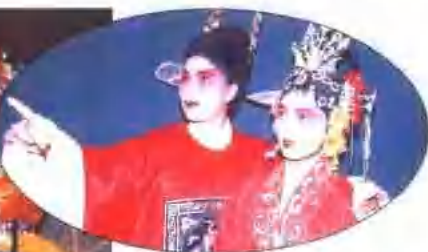
▲清苑县哈哈腔剧团演出剧照 ◀保定老调