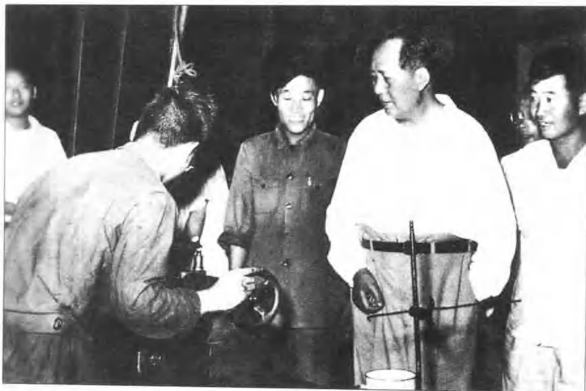
1958年中共中央主席毛泽东视察保定