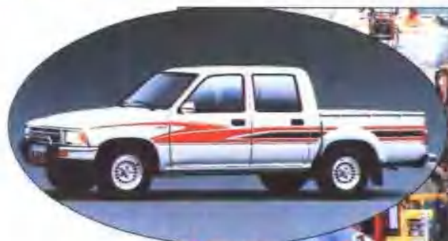
车制造 保定田野汽