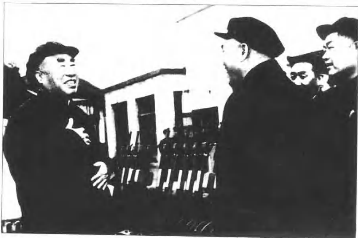
1964年9月全国人大常委会委员长朱德视察保定