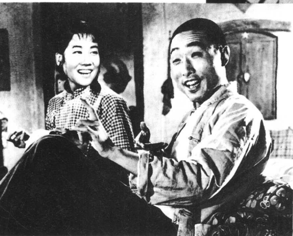
《李双双》海燕电影制片 厂（1962年）