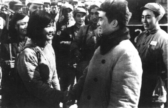
《南征北战》上海电影 制片厂（1952年）