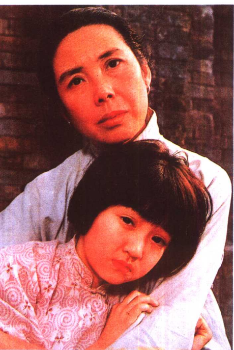
《城南旧事》上海电影制片厂 (1982年)