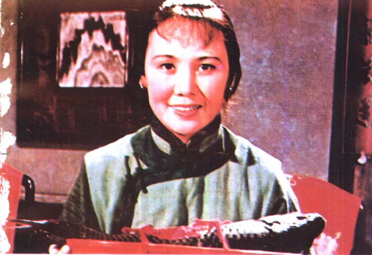
《祝福》北京电影制片厂 (1956年)