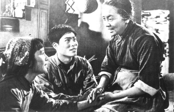
《枯木逢春》海燕电 影制片厂（1961年）