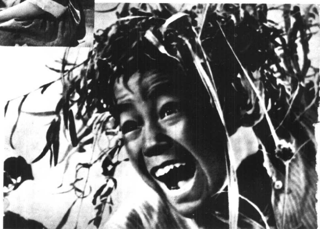
《小兵张嘎》北京电影制 片厂（1963年）