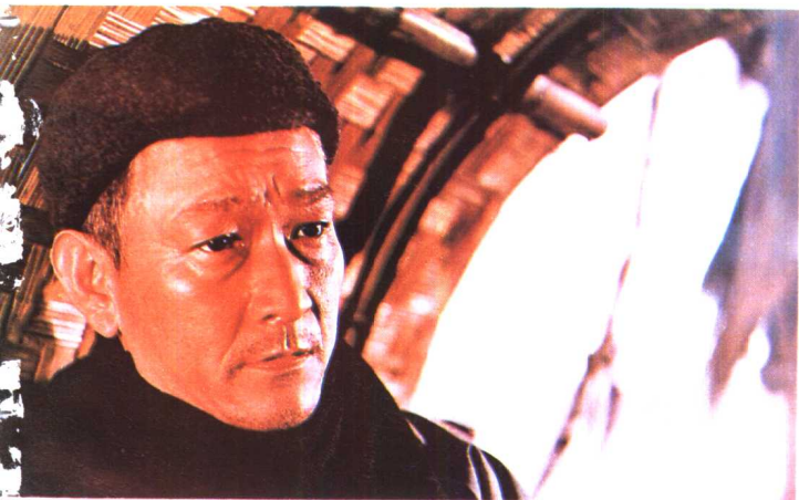
《林家铺子》北京电影制片厂 (1959年)