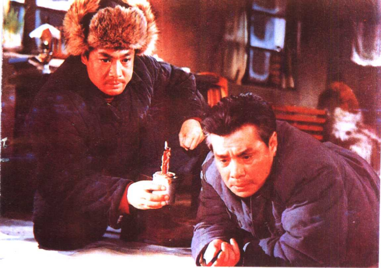
《创业》长春电影制片厂 (1974年)