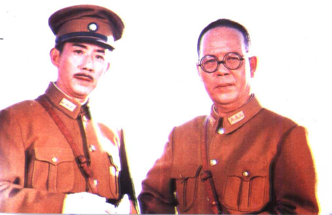
《西安事变》西安电影制 片厂（1981年）