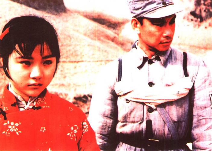
《黄土地》 西电影制片厂 (1984年)