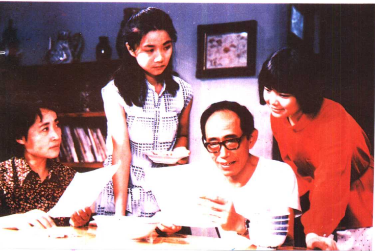
《红衣少女》峨眉电影制片厂 (1984年)