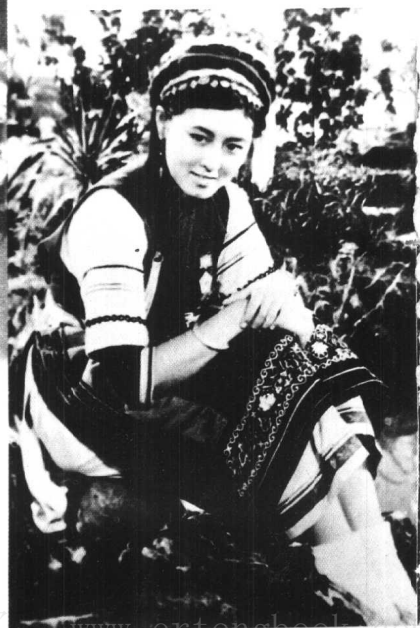
《五朵金花》长春电影 制片厂（1959年）