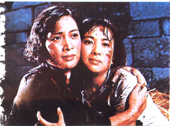
《青春之歌》北京电影制片厂 (1959年)