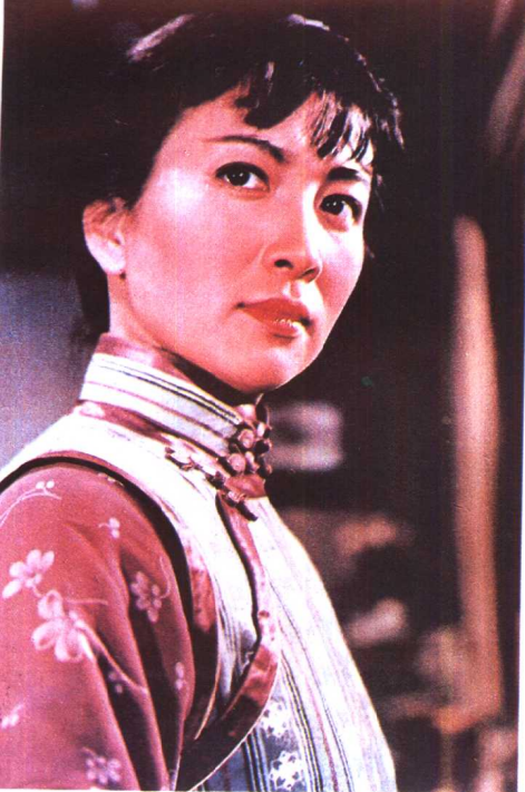
《早春二月》北京电影制 片厂 (1963年)