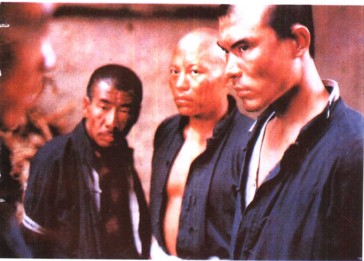
《一个和八个》广西电影制片厂 (1984年)