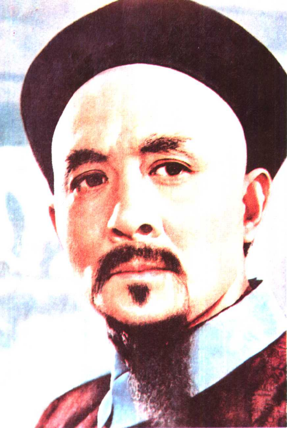
《林则徐》海燕电影制片厂（1959年）