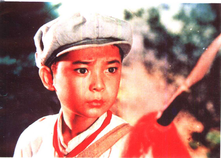
《闪闪的红星》八一电影制片厂 (1971年)