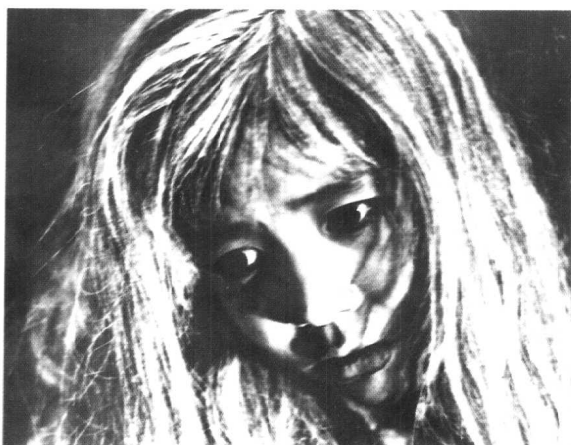
《白毛女》东北电影制 片厂 (1950年)