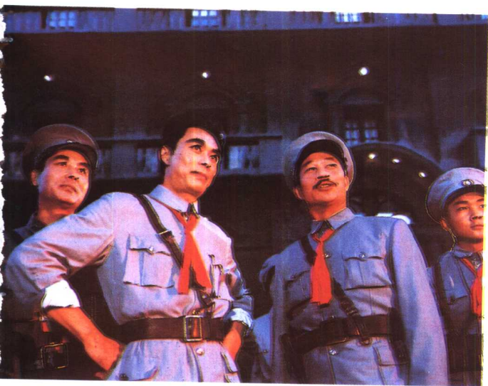
《南昌起义》上海电影制 片厂（1981年）