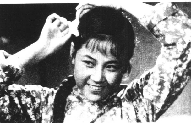
《柳堡的故事》八一电影制片厂（1957年）