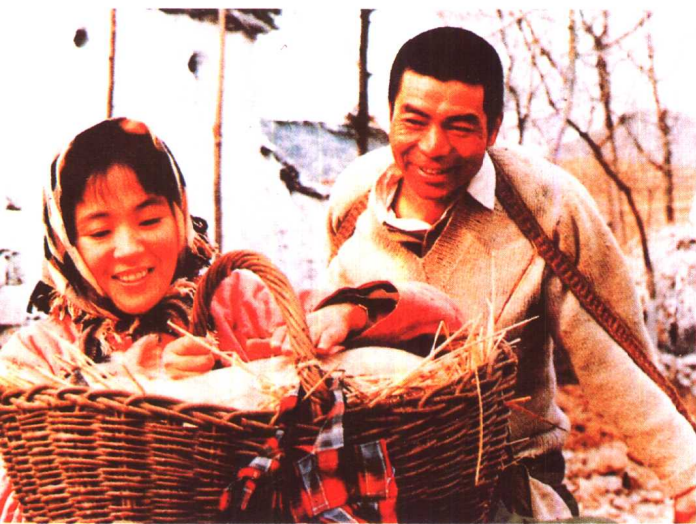
《高山下的花环》 上海电影制片厂 (1984年)