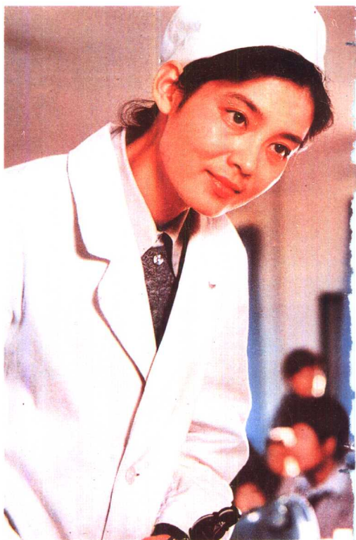
《人到中年》长春电影制 片厂 (1982年)