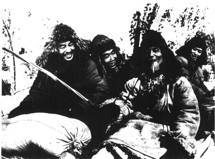
《老兵新传》海燕电影制片厂 (1959年)