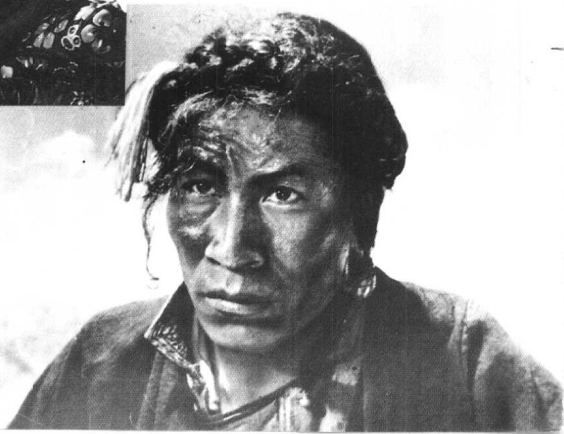
《农奴》八一电影制片厂 （1963年）