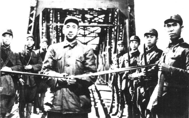
《桥》东北电影制片厂 (1949年)