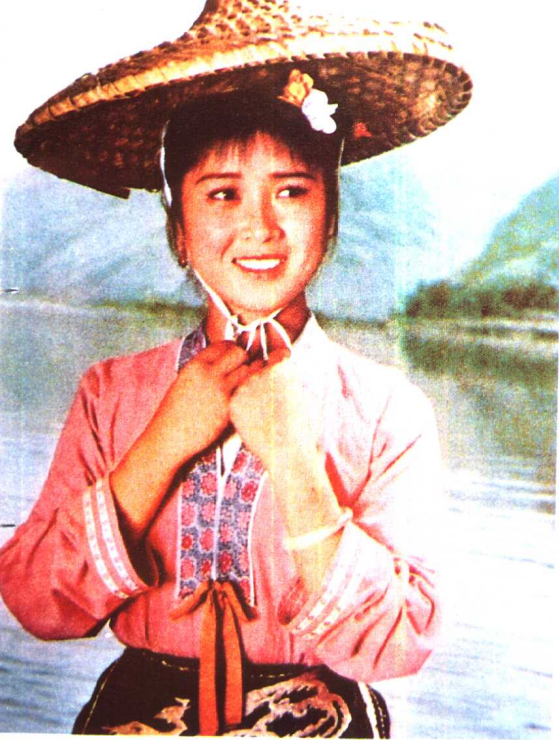
《刘三姐》长春电影制片厂（1960年）