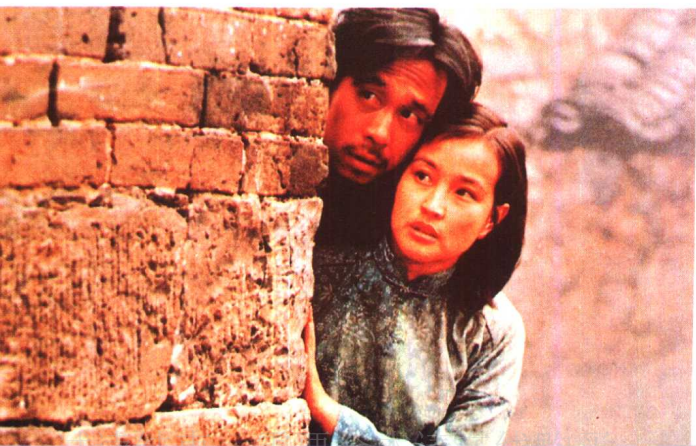
《芙蓉镇》 上海电影制片厂 (1986年)