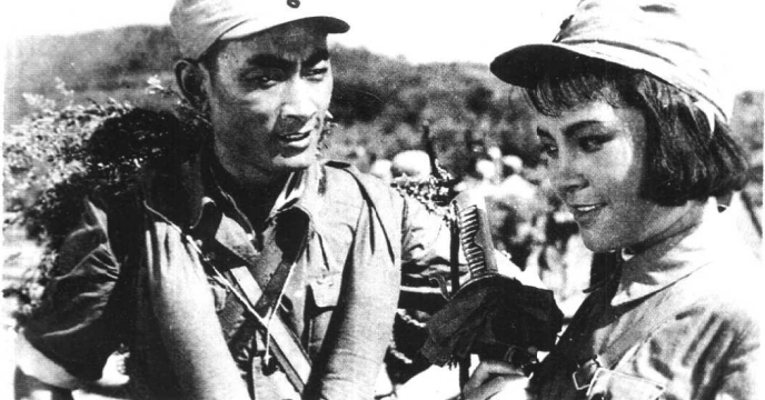
《战火中的青春》长 春电影制片厂 (1959年)