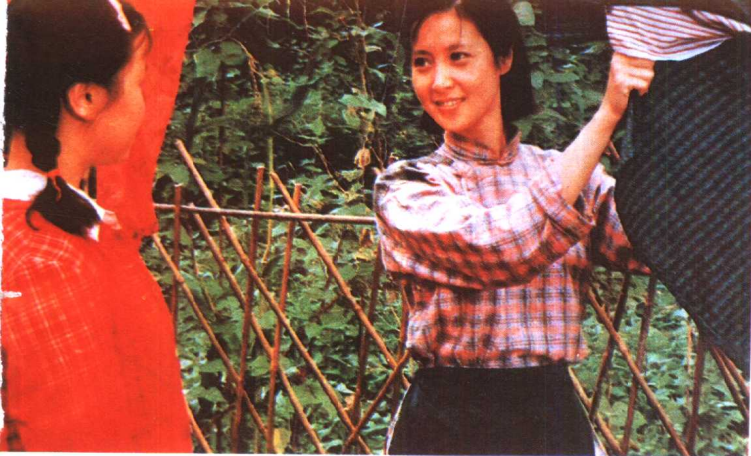
《乡音》珠江电影制片厂 (1983年)