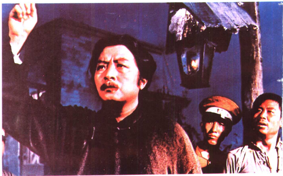
《风暴》北京电影制片厂（1959年）