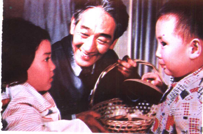
《邻居》北京电影学院青年电 影制片厂（1981年）