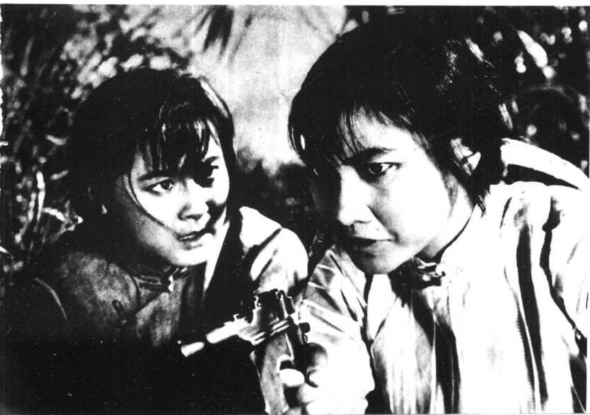
《红色娘子军》天马电影制片厂 (1961年)