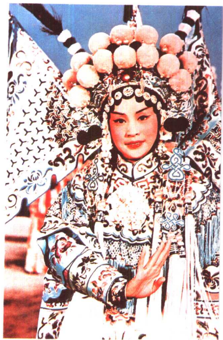
《杨门女将》北京电影制片厂（1960年）