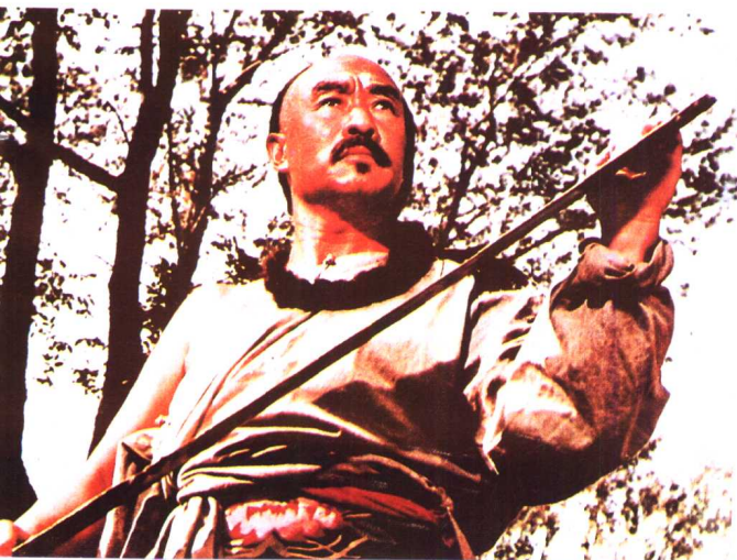
《红旗谱》北京电影制片厂 天津电影制片厂（1960年）