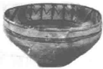
青海大通县出土的 舞蹈彩纹盆

远古时代的先民们就已经开始了舞蹈活动，并把它作为图腾崇拜的重要内容。最早的舞蹈常常是歌、舞、乐三者合为一体，既是巫术礼仪，又是歌舞活动。舞蹈还和人们的生活紧密联系在一起，原始舞蹈中就有对狩猎活动或战争场面的模拟。青海大通县出土的“舞蹈彩纹盆”生动地记录了5000年前原始舞蹈的情境。我国商代的巫舞、周代的文舞和武舞、春秋战国时代的优舞以及汉代百戏中的舞蹈都曾盛行一时。唐代舞蹈更加兴盛，除了大型宫廷乐舞“立部伎”、小型宫廷宴乐“坐部伎”外，还有“健舞”、歌舞大曲如《霓裳羽