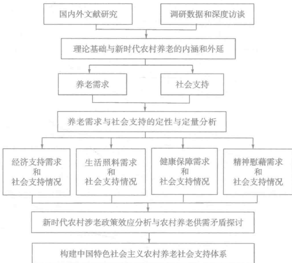
图 1.3 技术路线图

在国内外现有研究的基础上，对新时代我国农村老年人养老需求和社会支持进行概念界定和系统分析，并认为在供需平衡视角下养老需求即是养老社会支持的目标和主要内容。基于宏观数据，在对我国当前农村老年人的养老需求及社会支持现状分析的基础上，采用问卷调查和个案访谈方式，对农村老年人的养老现状及满意度进行补充调查。充分利用调查数据，从经济供养、生活照料、健康保障、精神慰藉四个维度，探讨农村老年人的社会支持状况，并积极探讨农村老年人社会支持体系所存在的问题及其成因，分析中国特色社会主义农村涉老思想和涉老政策的理论价值、实践意义与政策效应，最后构建中国特色社会主义农村养老社会支持体系。本研究技术路线如图 1.3 所示。