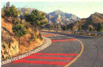
图2-8 装饰混凝土公路