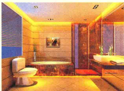
图1-7 卫生间石材装饰