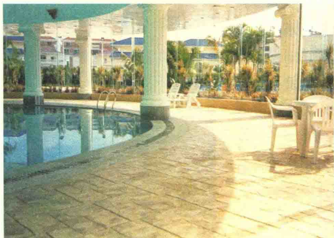
图2-9 装饰混凝土庭院应用

彩色外加剂不同于其他混凝土的着色料, 它是以适当的组成、按比例配制而成的均匀的混合物。它不仅能使混凝土着色, 而且还能提高混凝土各龄期的强度, 改善混凝土拌合物的和易性, 对颜料和水泥具有扩散作用, 使混凝土获得均匀的颜色。彩色外加剂与彩色水泥配合使用, 其效果会更佳。