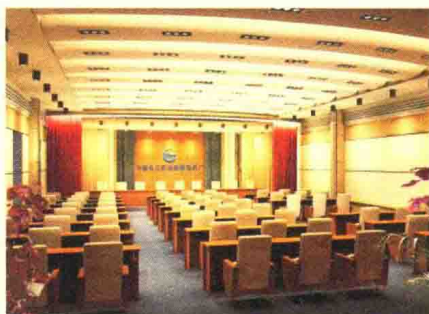
图1-8 会议室吊顶装饰