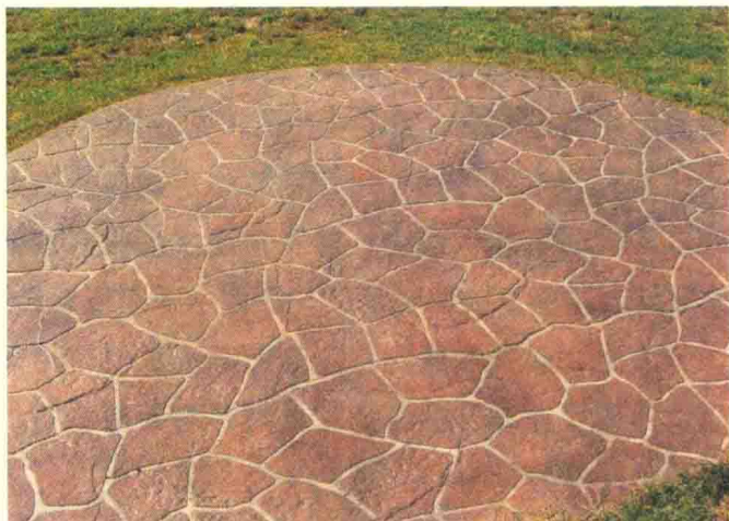
图2-10 装饰混凝土绿地应用