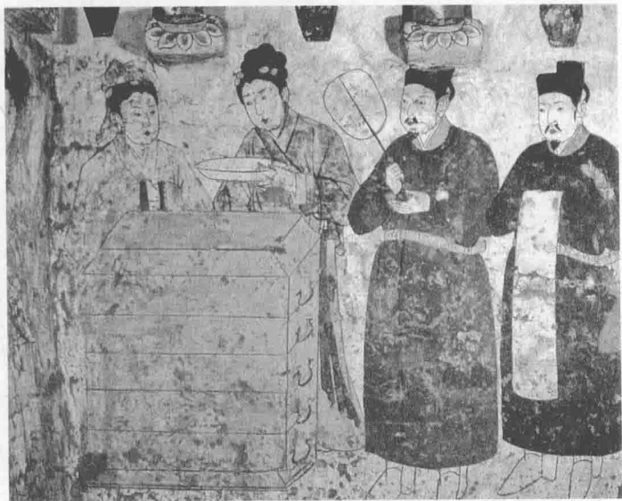
男女侍图 辽 佚名

这幅辽代壁画描述了四位侍者恭候主人的场景，侍者神色平和。可以看出此时的侍者已安于该社会阶层，社会各阶层的定位已非常稳定。