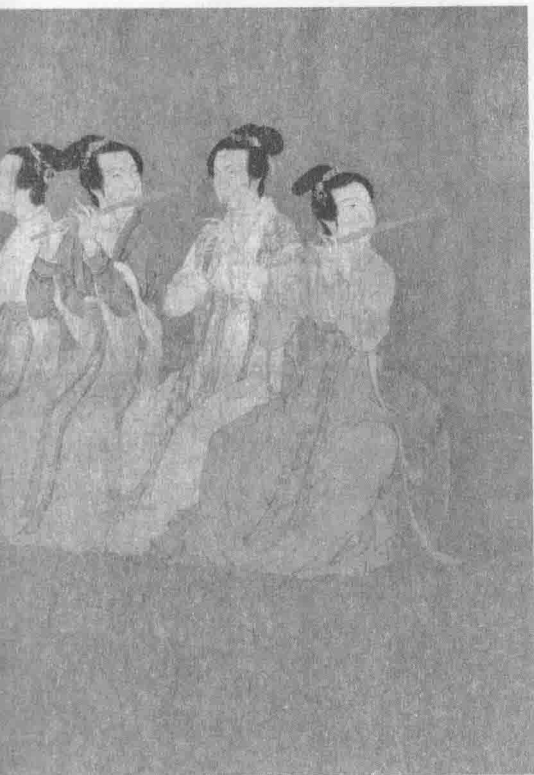
韩熙载夜宴图 南唐 顾闳中

此图描绘了官员韩熙载家中设夜宴时载歌载舞的场面。画中一名打板男子端坐在椅子上，五名吹奏管乐的女伎横坐一排，姿态不一。我国乐律知识有着非常悠久的历史，是非常值得学习、研究的。