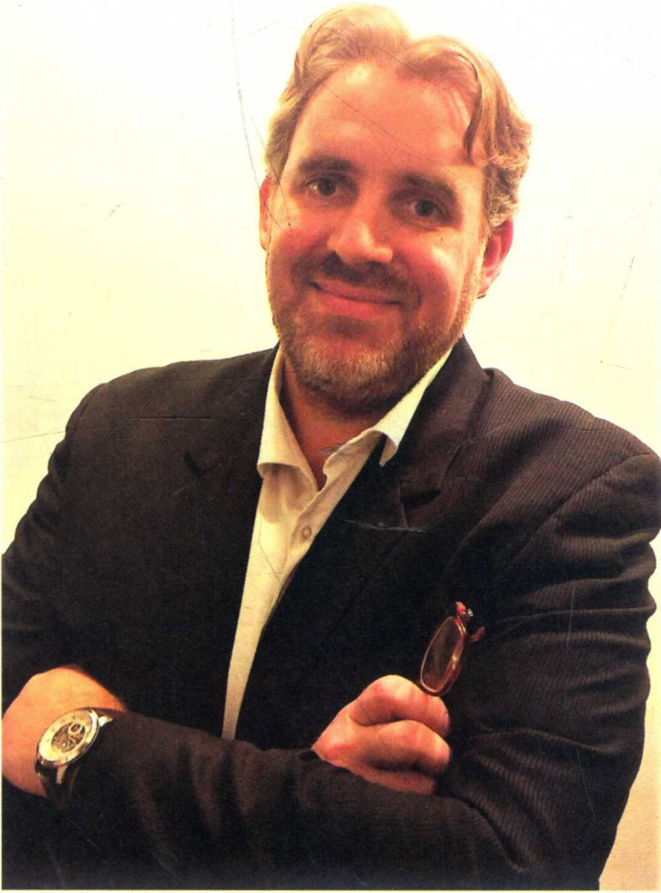
作者克里斯托弗·勒夫维斯 ( Christophe LEFEVRE )