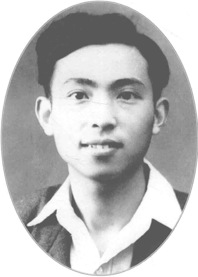
1935 年至 1937 年在北平清华大学期间