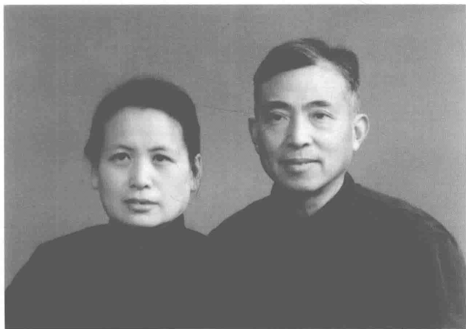
1972年“文革”告一段落，夫妇合影于天津，纪念熬过了重重磨难