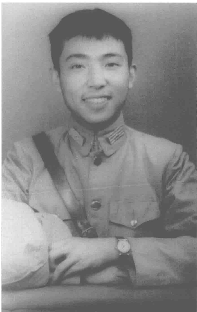
1942年8月随中国入缅远征军撤到印度， 10月摄于印度加尔各答