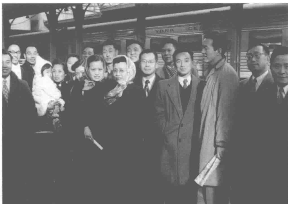
1952年12月，穆旦夫妇离开芝加哥回国， 在火车站与送行的同学和朋友们合影