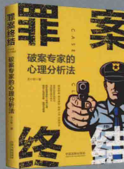
《罪案终结：破案专家的心理分析法》