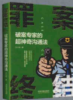
《罪案终结：破案专家的超神奇沟通法》