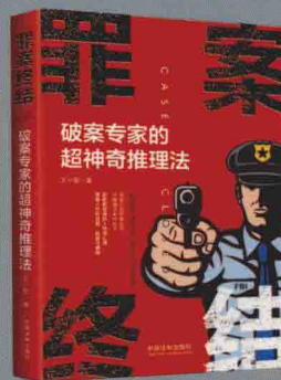
《罪案终结：破案专家的超神奇推理法》