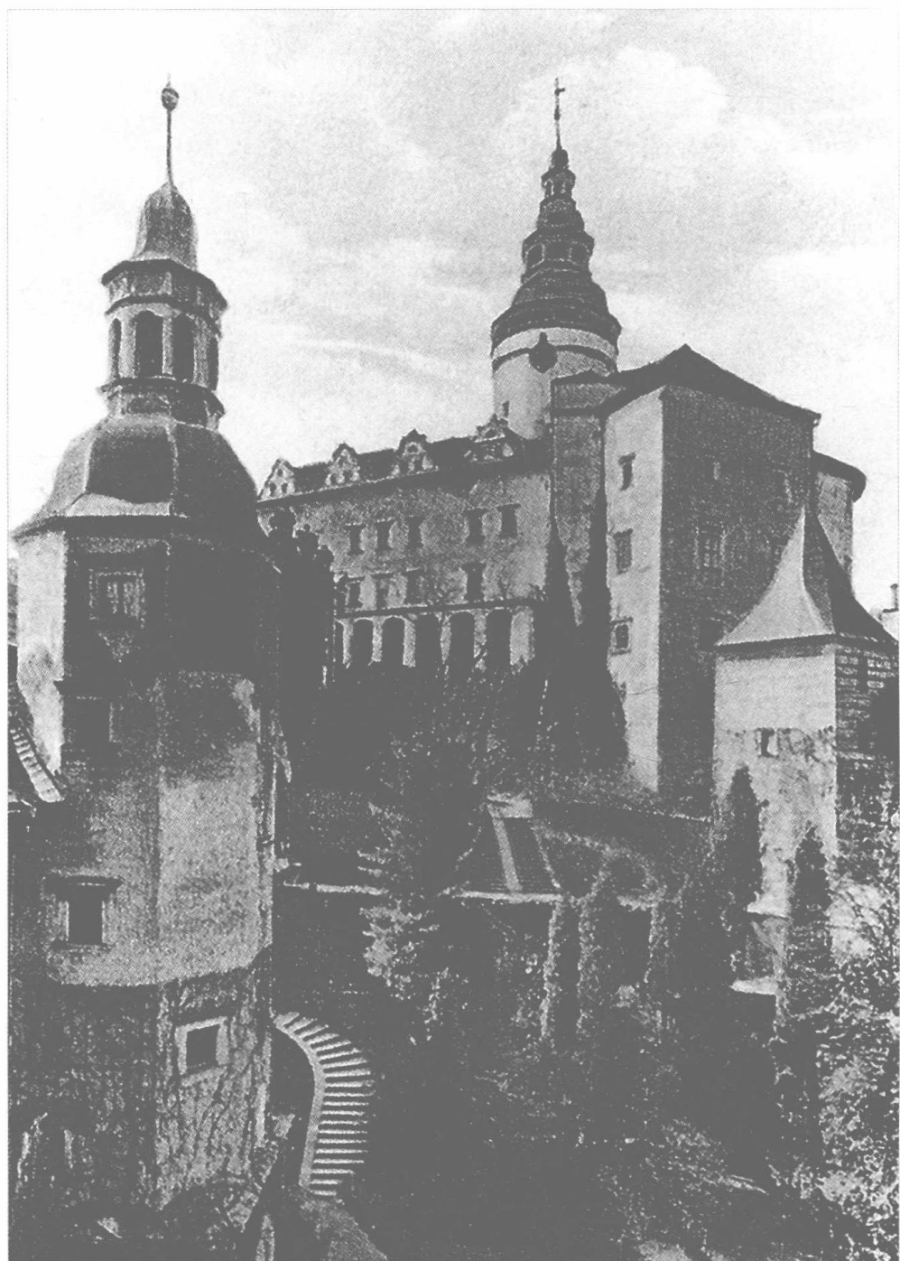
布拉格附近的一座城堡