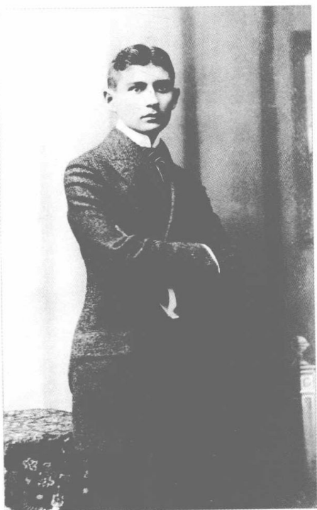
卡夫卡（1906年获博士学位时）