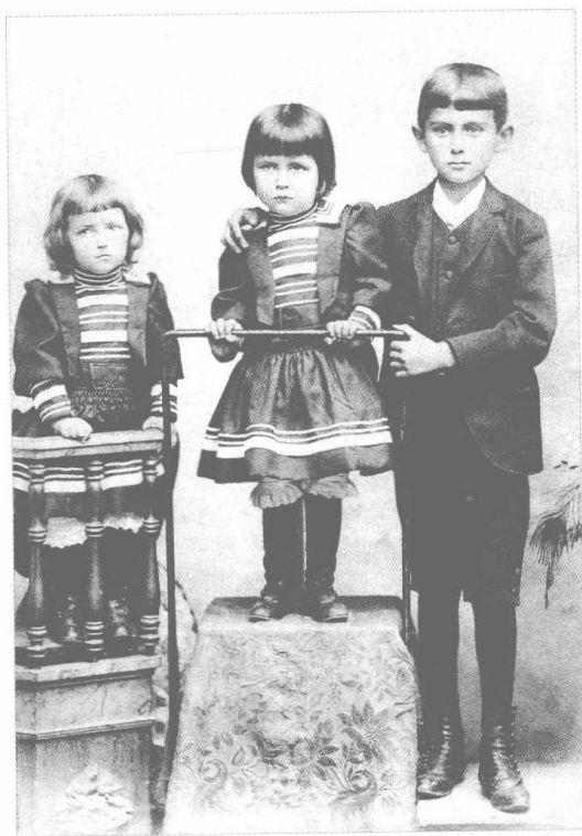
十岁时的卡夫卡和妹妹 瓦莉（左）及艾丽（中）