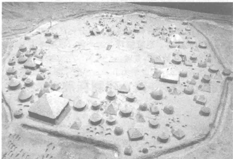
图 1-1 姜寨聚落遗址 (西安市临潼区)