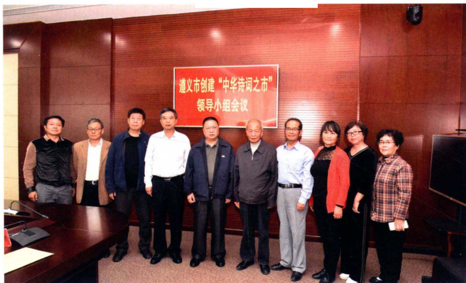
遵义市诗词楹联学会领导班子及办公室人员合影