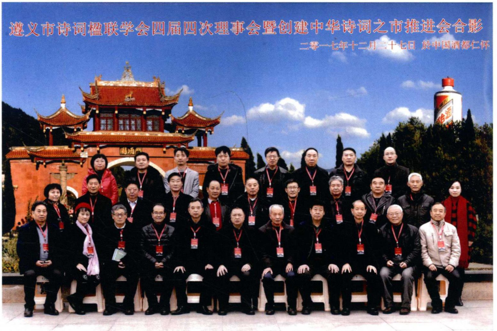
第四届理事会成员合影