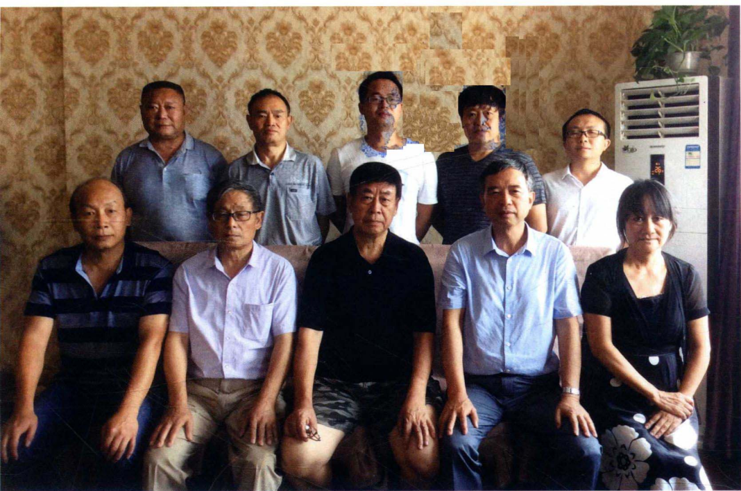
各卷书主编、副主编合影