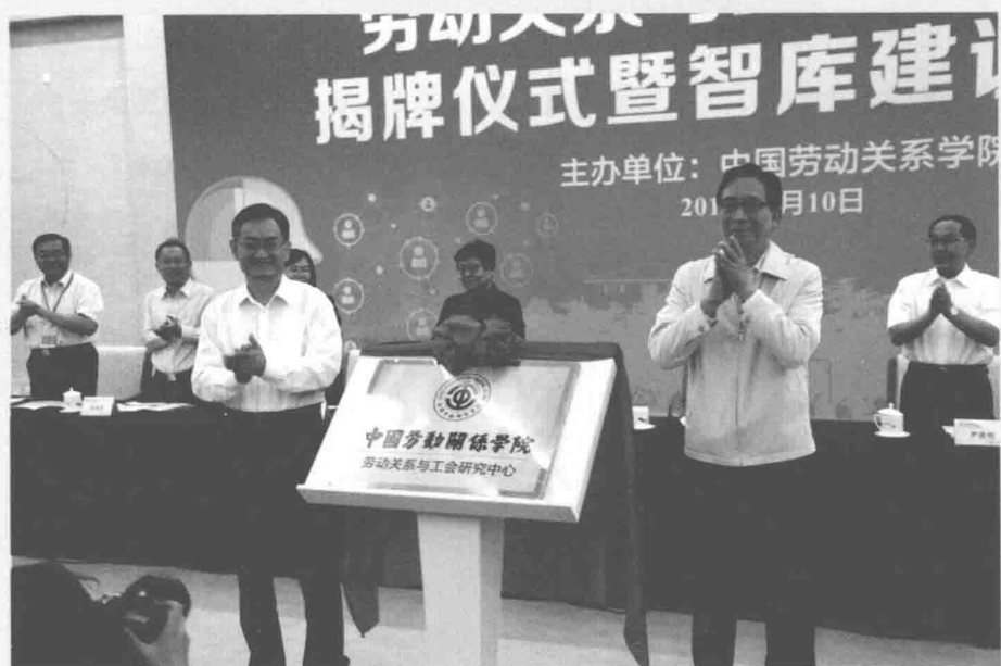
2017年6月10日，中国劳动关系学院劳动关系与工会研究中心揭牌仪式暨智库建设研讨会隆重举行