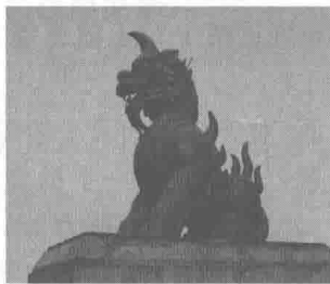
图 1-1 中国古代传说中的断案神兽廌 ①

上述关于“法”的由来属于中国古代的神明裁判，也就是借助于神(獬豸这一种传说中的神兽)的力量和方式来考察当事人，以确定是非曲直，判定其有罪或无罪的原始审判方式。