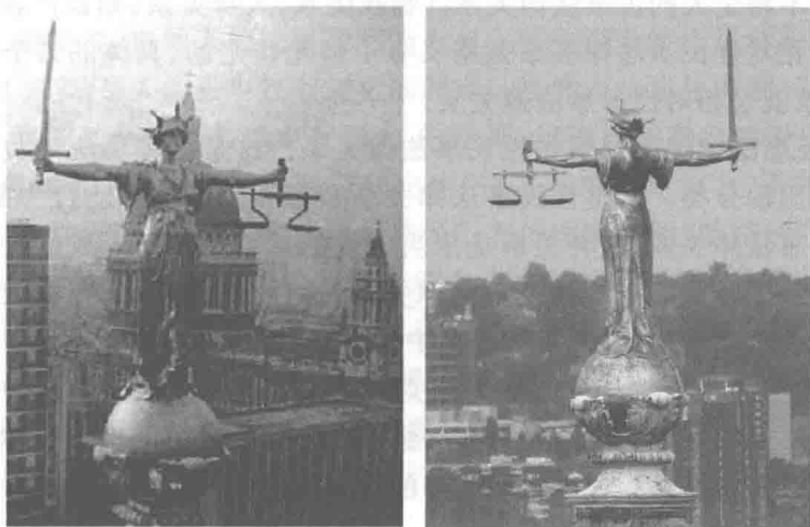
图 1-2 英国伦敦的英格兰和威尔士刑事法院 (Central Criminal Court of England and Wales)屋顶的正义女神