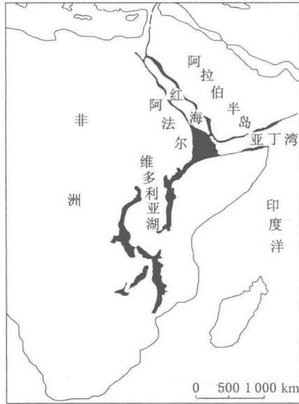
图 1-2 东非大裂谷示意图