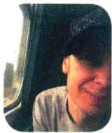
普热梅斯瓦夫·维和特洛维奇

波兰著名儿童图画书作家、诗人。作品曾获得白乌鸦奖、华沙图书奖等，被多国出版，并被译为英文、德文、法文等。国内已出版童书包括《抱抱我，好吗》《泰格的丛林日记》《弗洛格的微笑》《小鱼和太阳》《生命追求》《蚂蚁小姐想结婚了》《我爱你，老虎先生》等。