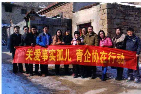
△高度强关注事实孤儿成长