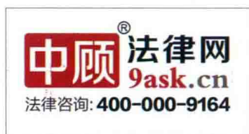
△高度强于 2005 年创办中顾法律网