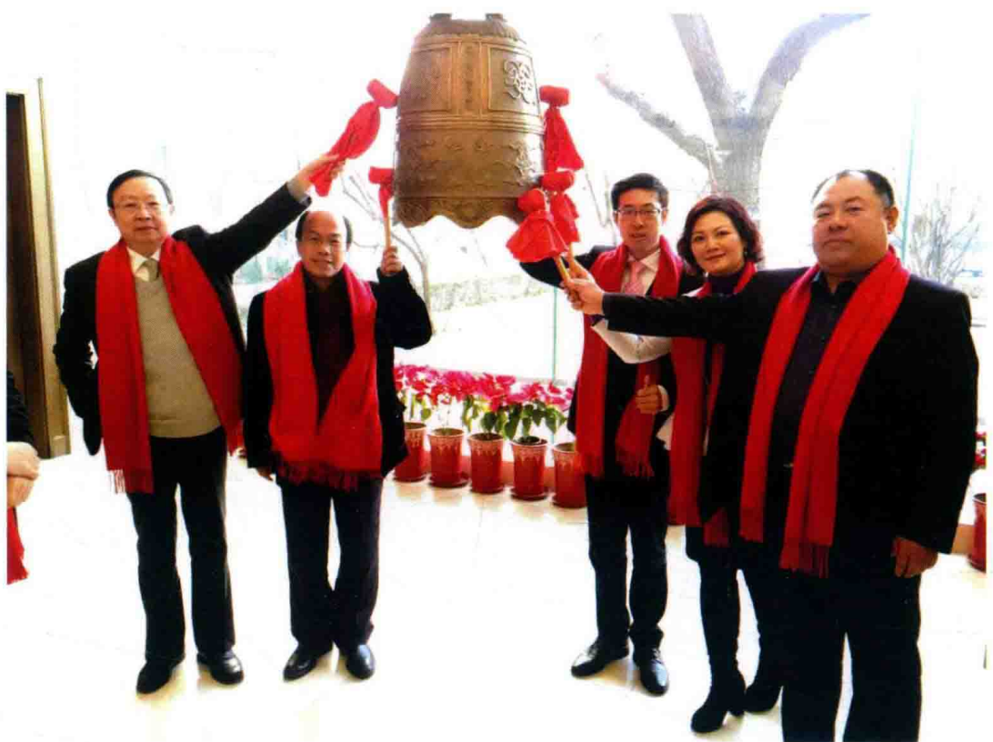
△高度强创办的第二家公司成功挂牌新三板