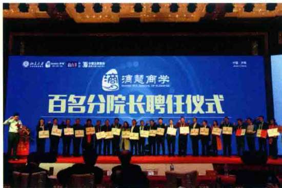
△ 高度强为百名分院院长颁发聘书