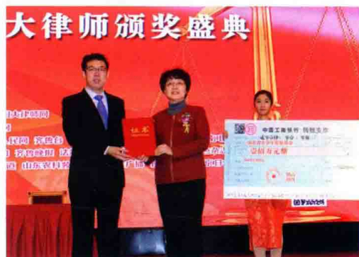
△高度强为山东省青少年发展基金捐资