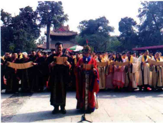
△ 高度强与上千位法商领袖共同宣读《法商宣言》

慧巍华夏 合分于今 聚俗成习 伙颐礼存 法演改律 忠国孝亲 商德业道 顾复之恩 天地人和 参赞乾坤 勤能补拙 善为根本 诚以立商 信以立身 精进继业 厚德乐群 法者同心 后乐胸襟 汇聚众志 同起热忱 高屋建瓴 抵固根深 复兴法商 履信思顺 度德量力 不计伐勋 遍览群书 强识博闻 行成于思 业精于勤 传道解惑 金声玉振