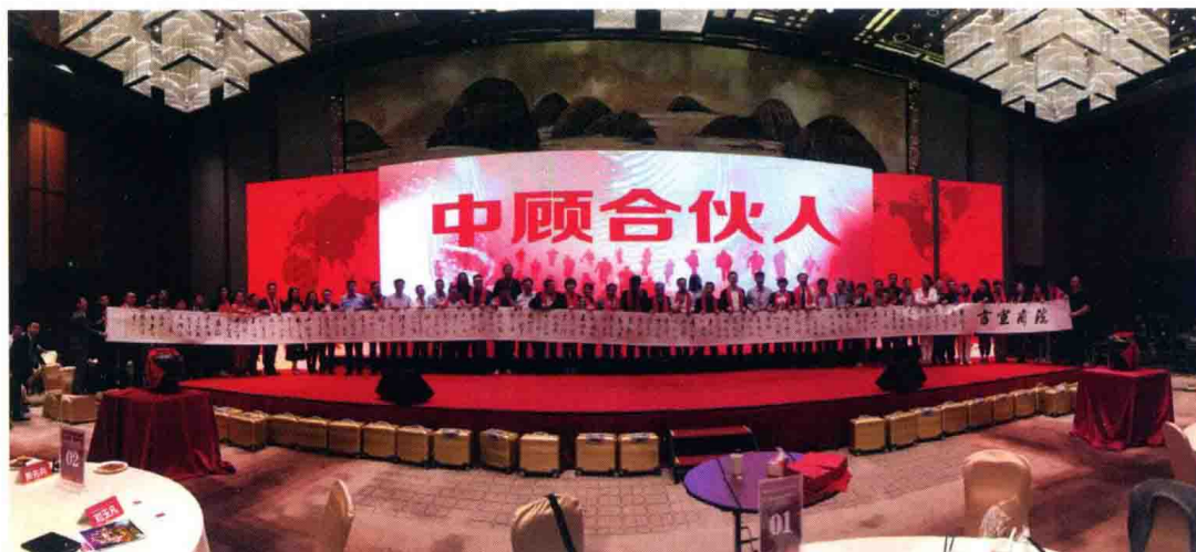
△ 高度强打造的中顾合伙人体系