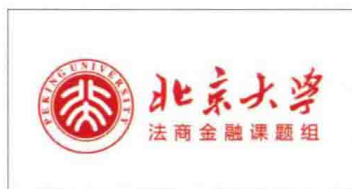
△高度强于 2015 年成立北京大学法商金融课题组