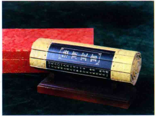
△ 《法商宣言》竹简陈列在法商博览会上