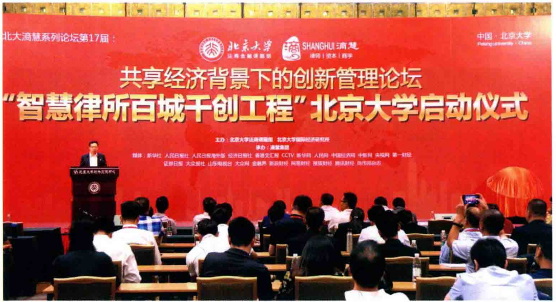
△ 2017年9月，“智慧律所百城千创工程”启动