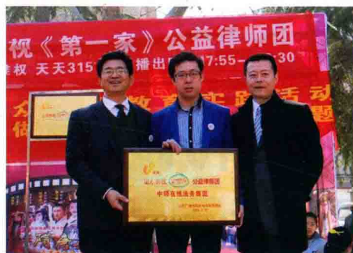
△高度强组织公益律师团关注社情民生