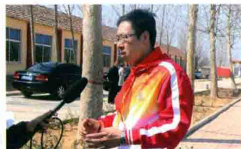
△ 高度强接受各界媒体采访