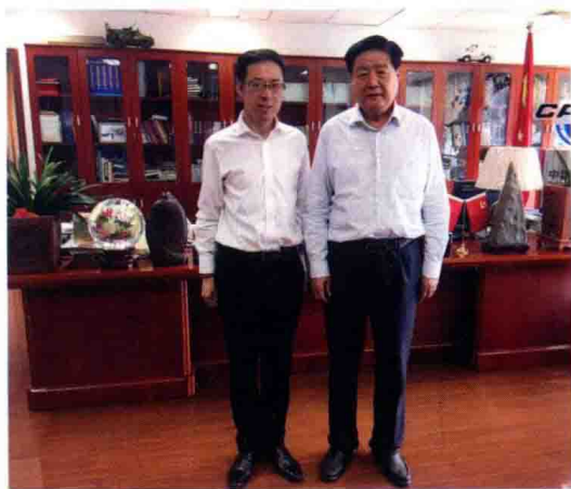
△ 高度强与中国中小企业协会会长李子彬