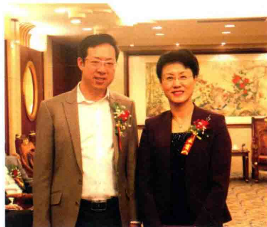
△ 高度强与北京大学经济学院院长孙祁祥