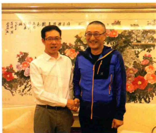
△ 高度强与著名财经评论家水皮先生