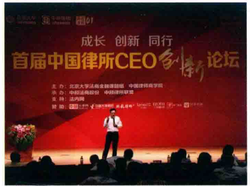
△ 高度强主持首届律所创新论坛