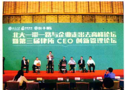
△ 高度强主持北大“一带一路”论坛