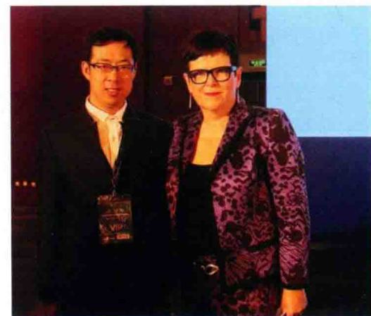
△ 高度强与新西兰前总理珍妮·玛丽·希普利