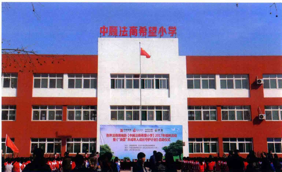
△高度强捐建的全国第一所以法商命名的希望小学（位于山东禹城市）