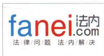
△高度强于 2010 年创办法内网