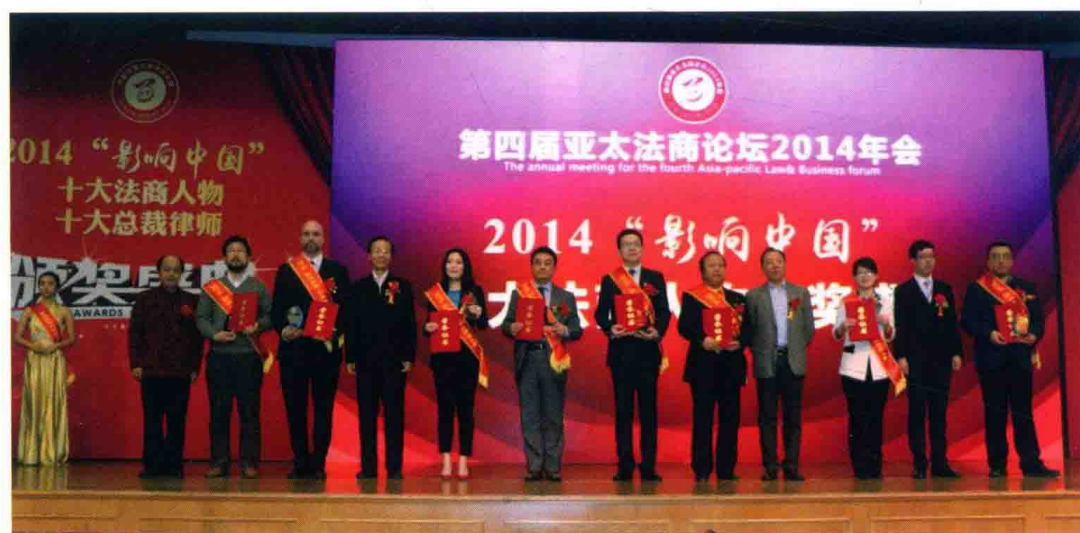
△ 蔡崇信被评为2014“影响中国”十大法商领袖