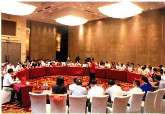
△ 高度强主持律师界 G20 峰会