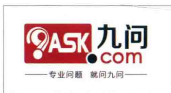
△高度强于 2006 年创办九问网