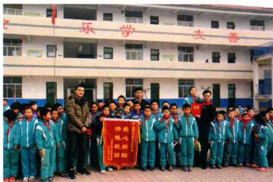
△高度强爱心捐助情暖校园活动