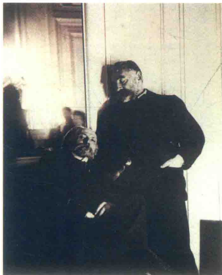
图3 德加拍摄的照片,坐者是雷诺阿。