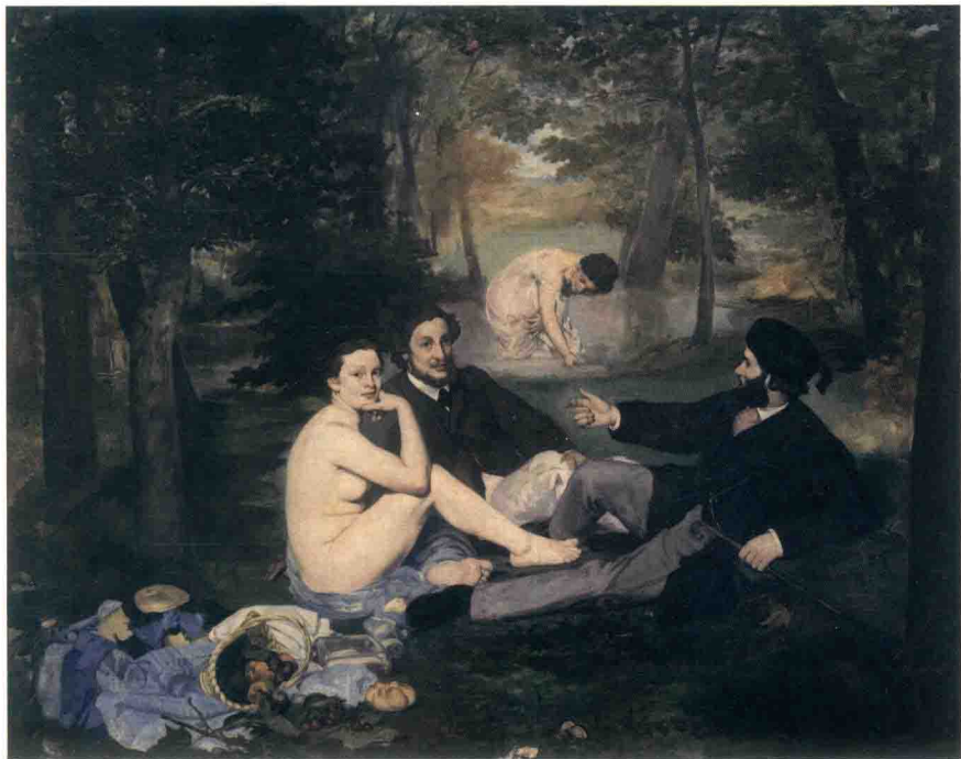
图1 马奈《草地上的午餐》

在印象派里人物画得最好的要数法国画家雷诺阿，他是印象派画展的积极参与者，在世的时候已经出了名，是印象主义画家中最有知名度的大师。他的作品主要表现巴黎人的悠闲生活：休闲，喝茶，跳舞。受到了有钱人的青睐，作品也就越来越好卖。1882年他去意大利旅行，深深地感受到意大利的美丽，他说：“大街上挤满了异教神和《圣经》中的人物，每一个哺乳的妇女都是拉斐尔笔下的圣母。”雷诺阿喜欢创作优美的主题，画中的人物都具有丰满、圆润的面孔和红彤彤的双颊(图2)。