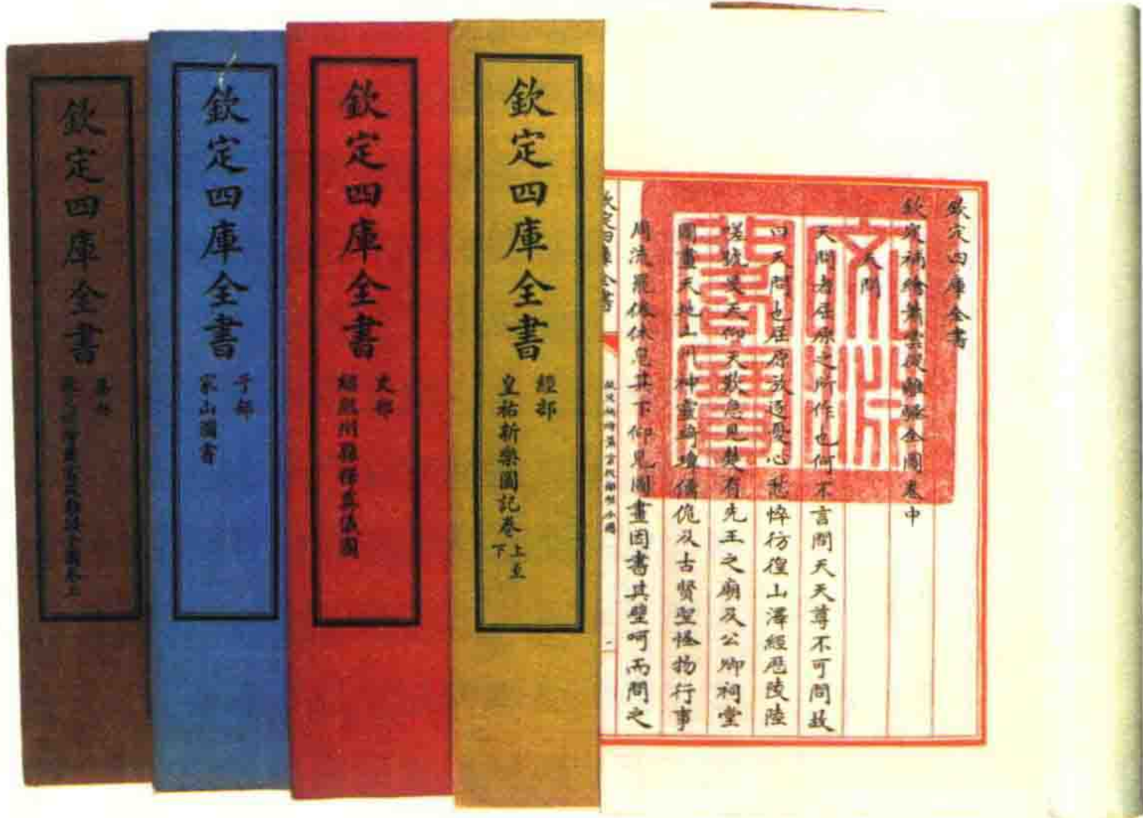
《四库全书》书影。 《四库全书》包括经、史、子、集四部，收书3461种、79309卷，存目书籍6793种、93551卷，基本保存了乾隆朝以前的重要著作。

清朝保持了长期的社会稳定，人口大量增加，但同时也带来了一系列严峻的社会问题。首先是人均耕地越来越少，人地矛盾非常尖锐，底层人民生计难以保障。随着吏治的腐败和土地兼并的发展，矛盾愈发尖锐。为求得生存空间，许多人转移到深山老林开荒，一方面破坏了当地环境，另一方面也成为社会一大不安定因素。清前期江南、华南部分地