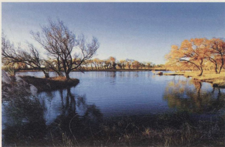
▼幽静的巴林左旗湖泊

也是如此。相传远古时候，有个“神人”乘着一匹雄健的白马，自马孟山（今内蒙古喀喇沁旗马鞍山）沿土河（今内蒙古老哈河）从上游来到下游，遇到了一个骑着青牛的美貌少女，少