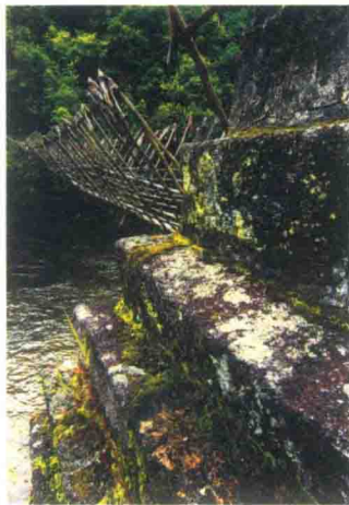
藤索桥 云南省腾冲三岔河