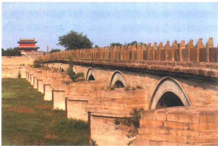
石拱桥（联拱） 北京市丰台区卢沟桥