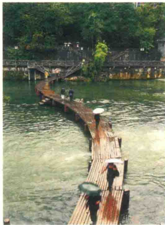
木梁桥 湖南省凤凰县沱江