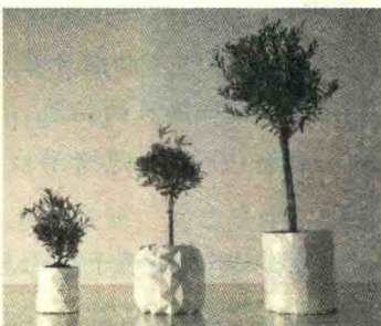
图 1-2 创意设计·和花草一起长大的花瓶