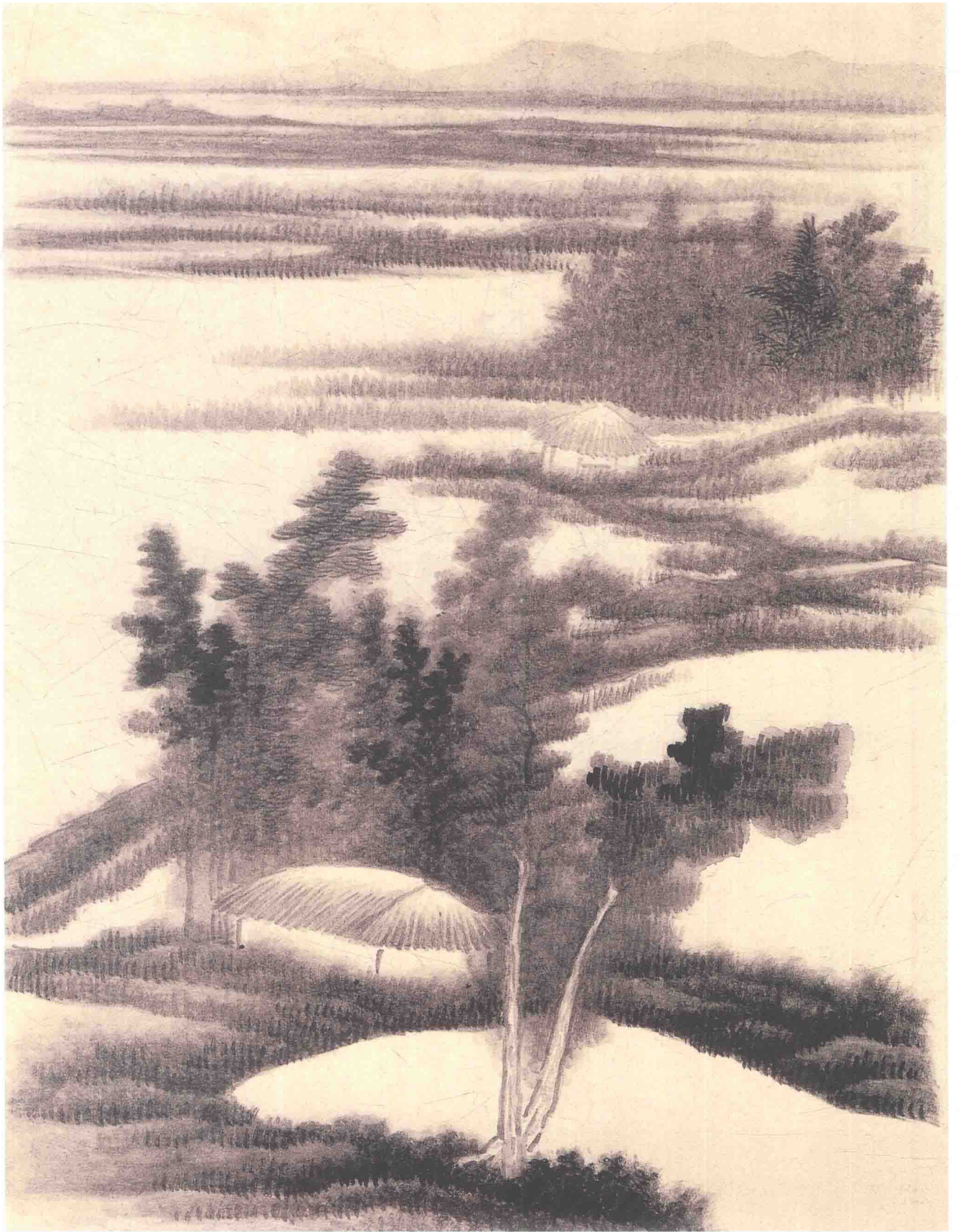
龚贤 山水图册（之一） 清 绢本墨笔 纵36.5厘米 横27.7厘米 上海博物馆藏

《山水图》册共二十四开，本书选录其中一开。所绘多为高岗茅亭、丘壑疏林、溪河沙渚、陡坡流泉、田畴板桥、层岭云霭等平远景致。技法既有勾皴简疏、墨色轻淡的面貌，又有重勾复皴、墨气沉厚的风格，同时注重墨色的虚化晕染，营造云雾迷茫、霭气沉沉的气氛，这些技法逐渐构成龚贤晚年的笔墨特征。