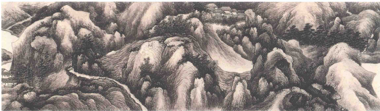
龚贤 山水图卷—清 纸本墨笔 纵 28.3 厘米 横 404 厘米 故宫博物院藏

《山水图》卷以深远、平远法绘江南水乡的绮丽风光，非游名山大川者，笔墨所不能达。画中散落落的茅舍、村庄，通达两岸的石桥，绕山的小路，葱郁的林木，安排合理，疏密错落。在浓黑的“积墨”技法中，又是处处留白，形成黑白强烈对比，使观者不因见其笔墨的浓重而感到压抑、厌倦，这就是画家着意要表现的“积墨”与留白形成的生动气韵，既符合对自然景物的描绘，又具艺术上的和谐统一。在中国山水画中能如此成功地表现光的强弱、向背，尚不多见，这无疑与作者细心观察自然界的变化，以及以“造物”为师的艺术创作思想有着密切的关系。