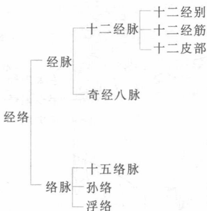
图 1-1 经络系统