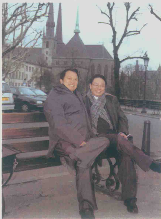
| 与孙光荣国医大师在欧盟考察时合影（2003年12月）