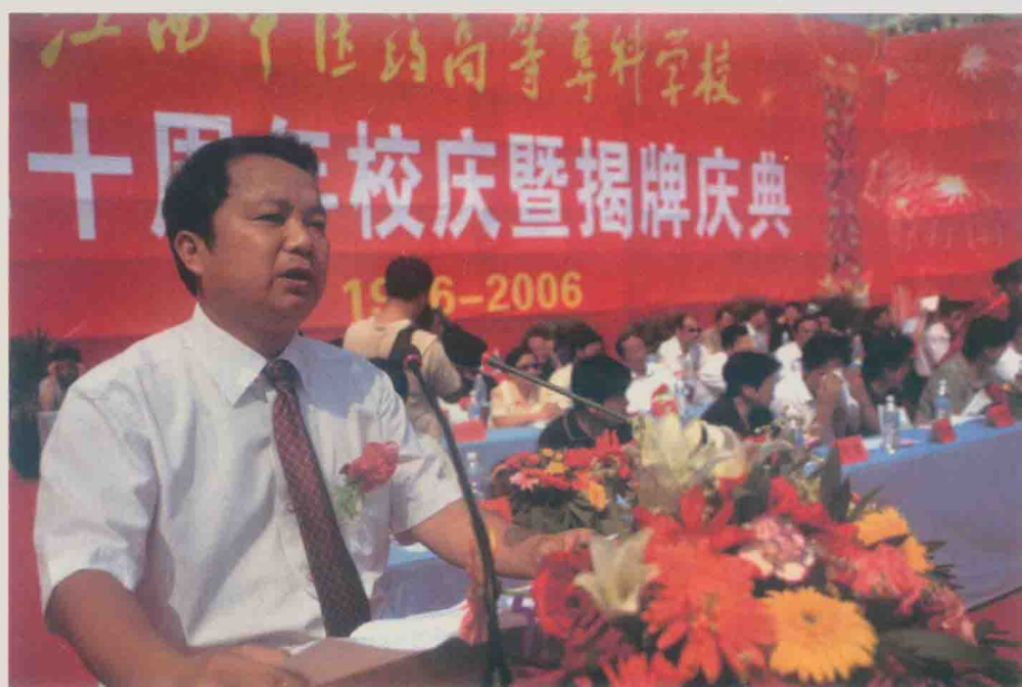
| 在江西中医药高等专科学校挂牌庆典上作校长致辞 (2006年9月)