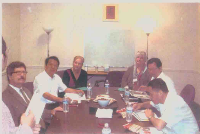
| 率团访问美国德州东方医学院 (2011年10月)