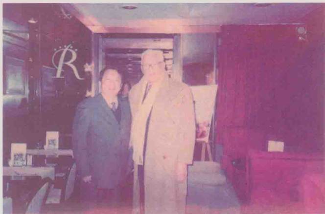
| 在布鲁塞尔访问时，与比利时前副首相德玛赫合影 (2003年12月)