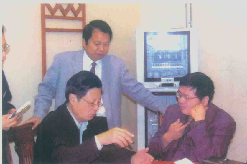
| 与王琦国医大师（左一）在抚州做体质学调查（2005年4月）