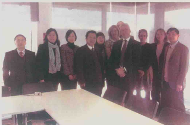
| 率团访问英国阿伯丁大学药学院 (2013年4月)