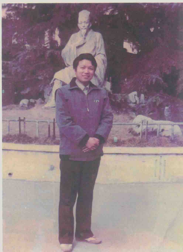
| 上海中医学院毕业时留影（1978年8月）