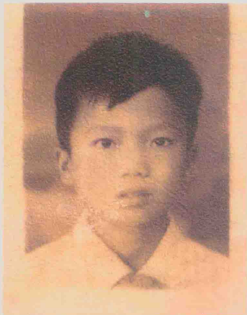
| 小学毕业留影 (1964年7月)