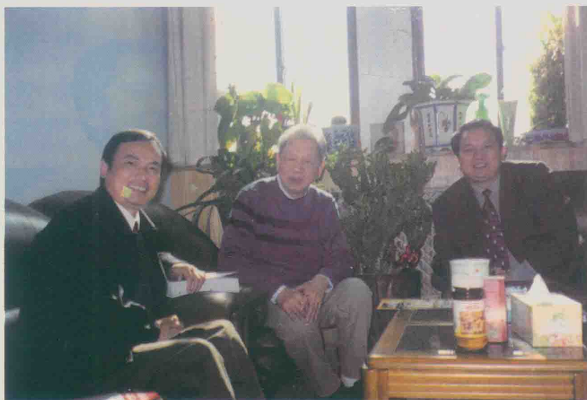
| 与陈可冀院士（居中）合影（2005年5月）