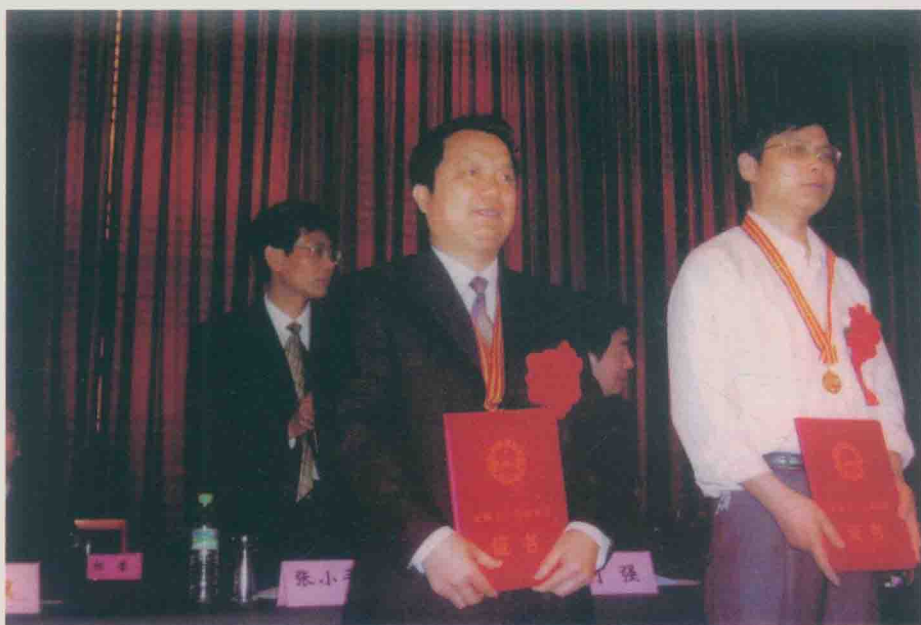
| 荣获“全国五一劳动奖章”(2006年5月)