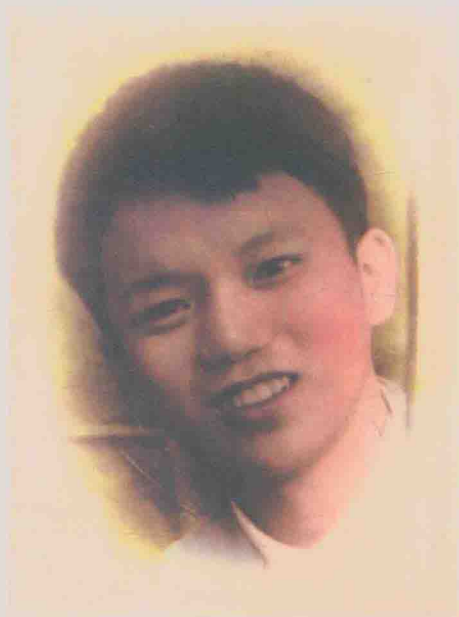
| 抚州卫生学校毕业留影 (1971年10月)