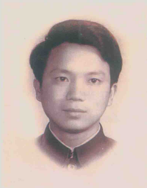
| 中国中医研究院学习时留影 (1993年11月)