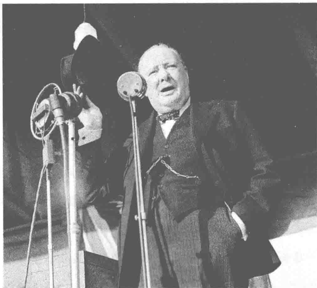
丘吉尔发表就职演说

就在礼拜五的晚上，我正式接受了国王陛下的委托，负责组成新一届政府内阁。我的这次组阁，包括所有政党，不但有支持上一届政府的政党，还有上一届政府的反对党。很明显，这是上下两院和国家的希望与意愿，我已经完成了其中最重要的部分。