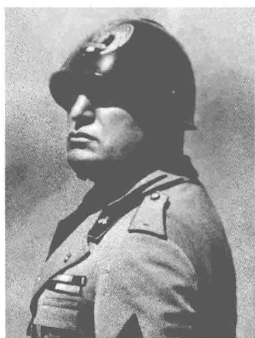
意大利独裁者墨索里尼

今形势一片大好，他认为完全可以利用英军被困欧洲的有利时机来扩张他的非洲版图。早在 20 年代，墨索里尼出任意大利总理时，便开始构筑夺取北非、重建地中海“新罗马帝国”的梦想。1935 年，墨索里尼出兵东非，一举占领厄立特里亚、埃塞俄比亚和意属索马里，并在殖民地利比亚屯兵 23 万，随时准备夺取东面的英属殖民地埃及。