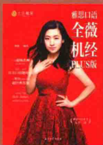
《雅思口语全薇机经PLUS版》