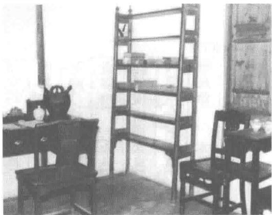
↑张闻天少年时期的卧室兼书房。

的关怀爱抚，江南水乡清新秀丽而又丰富多变的自然景观，陶冶了他温和自由、细致绵密的情致。张闻天生当世纪初新旧交替之际，时代风雷的激荡，欧风美雨的吹打，自然在潜移默化中给他以刺激和影响。