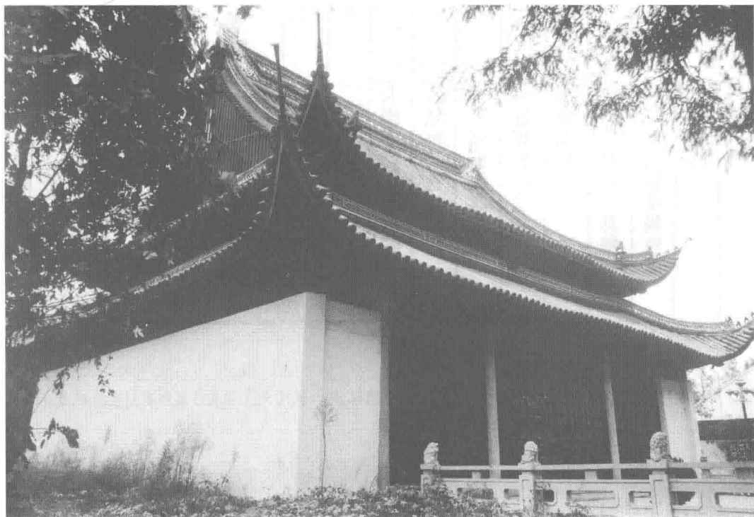
↓“南汇一高”旧址。

张闻天6岁发蒙，进设在张氏宗祠的私塾。第二年（1907）私塾改名养正小学，开始接受新知。1912年8月1日，入南汇县立第一高等小学堂，成为肇建中华民国后该校的第一届学生。“南汇一高”是一所新式学堂，全部采用商务印书馆、中华书局最新编辑出版的课本。学校教学认真，管理严格，教师中不乏新派人物。张闻天在全班年纪最小，功课出类拔萃。深思好学，讷于言而长于文，