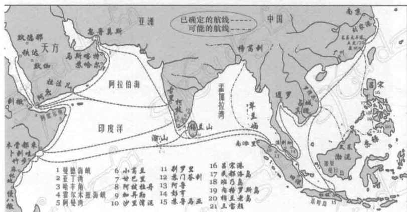
◆ 郑和下西洋路线图

在哥伦布1492年发现美洲大陆的70年前，中国的航海家郑和，就曾率领他的船队，到达了美洲大陆。据考证，他们曾经在大陆上小住过一段时间，而且与当地印第安人联络，成功绘制了当地的地图。但令人惋惜的是，他们并未细致研究，只留下零星的蛛丝马迹，便离开了这里。以上，是英国学者孟席斯在他的《1421：中国发现世界》中记载的故事。