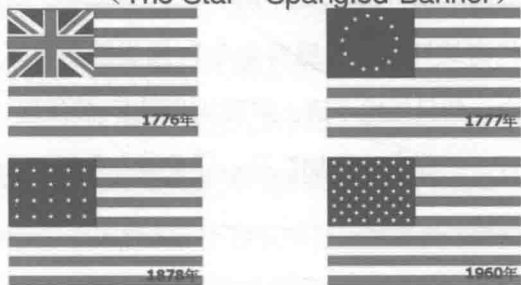
◆ 美国国旗的历史变化

原来，普雷沃斯特希望全歼美军，但自己仅有1艘军舰，不足以打败美军。要知道那时候美军在普拉茨堡的尚普兰湖上有麦克多诺少校指挥的14艘军舰，足以承担防卫任务。但如果有了唐尼少校的军舰，英军就有16艘战舰。再加上英军的陆军兵力，碾压美军绝对不成问题。正因为这个原因，普雷沃斯特选择了先将陆地上的敌人消灭。从6日到9日，两军在普拉茨堡附近打仗。英军约有1.5万人，而且大部分是刚刚在欧洲打完仗的老兵；相比之下，美军只有不足5000人，还基本都是民兵和临时拼凑的杂牌军。不过，美军的士气较高，这也是一大优点。果然，9日夜，美军突袭端掉了英军1个要