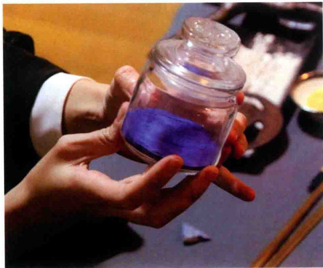
2016年岩彩技法教学直播视频截图

要发展，当然需要大量专业人才，培养人才则需要配套的教育。目前全国只有少数美术院校开设了岩彩专业，更多的学生是通过片段的、不成体系的网络教程在自学。同时，市面上能找到的岩彩类书籍，更多的是在科普何为岩彩、岩彩原石的成分、岩彩的相关理论研究等，受众是专业学者或博士研究生，而面向初学者讲授岩彩画绘制技法的书籍目前非常少，很难满足快速发展的行业 and 市场需求。