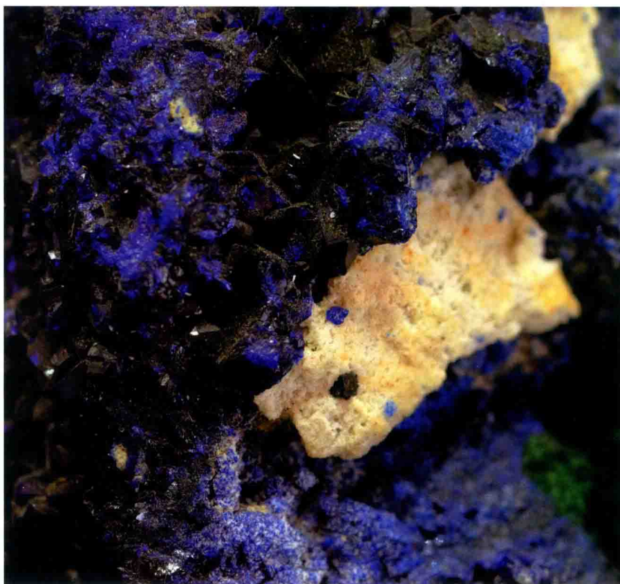
群青的原料——蓝铜矿

岩彩虽自古有之，但在我国被明确作为一个材料和画种的名字来使用，是在20世纪90年代。如今，岩彩被广泛地提起、讨论与实践，应当以材料、画种、流派还是其他角度去理解它，已成为一个亟待解决的问题。