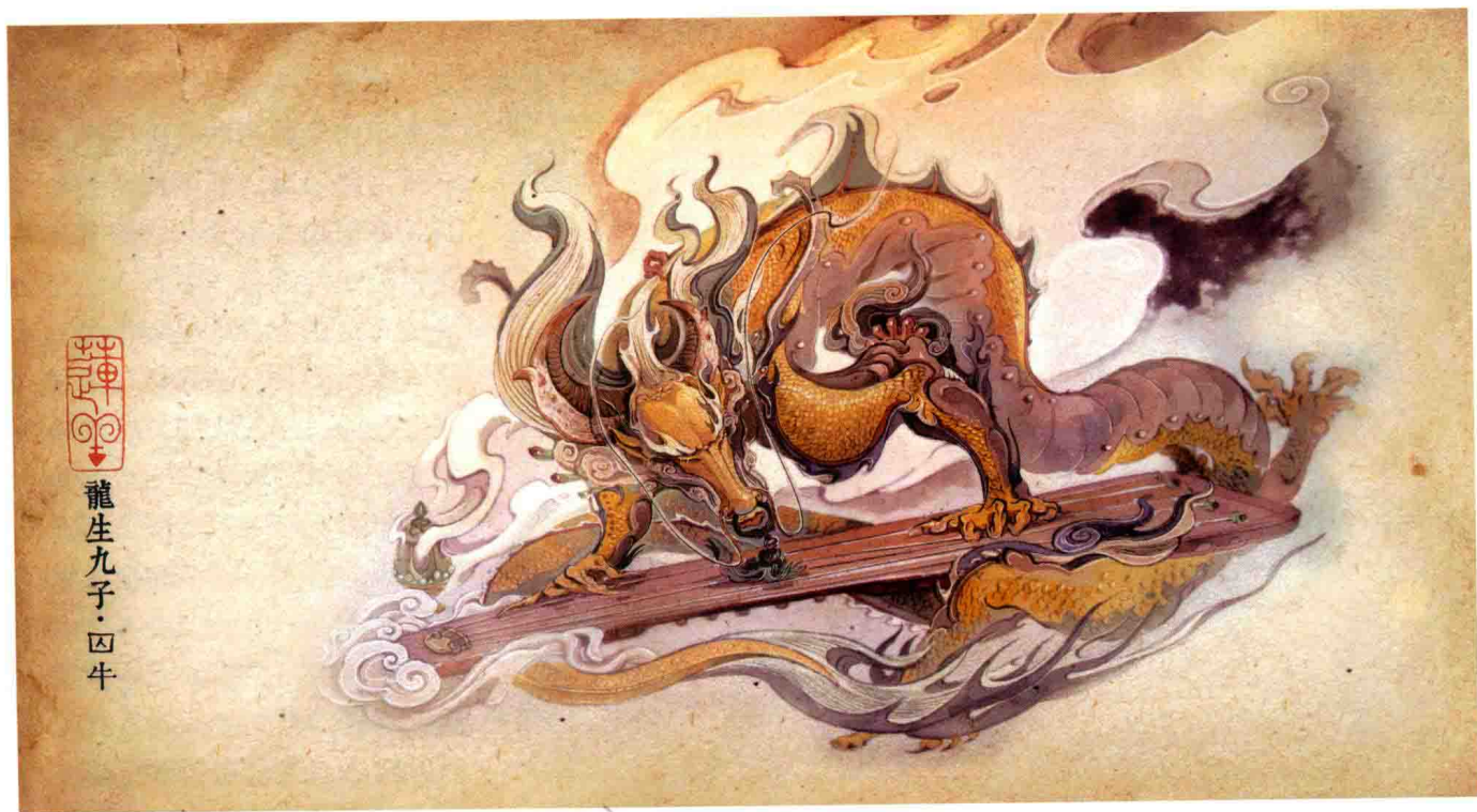
莲羊被称为造龙师时期的作品《龙生九子·囚牛》

头衔和称号这类东西，往往印证着那个时期的文化和社会特点。约8年前，出现大量冠以中国风这个前缀的头衔，如“中国风插画师”“中国风漫画家”“中国风设计师”等，是因为那个时期，市面上能见到的主流作品都不是中国风，占了大半个市场的是日风和欧美风，为了突出自己的传统性和民族性，大家才会强调“中国风”这个概念。头衔里冠以“学院派”几个字，大致在6年前流行，因为大量打着速成口号的美术培训机构通过几个月的模式化教育，几年间向业界陆续输送了数十万计的“画家”，科班出身的“画家”们为了和这类速成出身的区分开来，喜欢自称“学院派”。