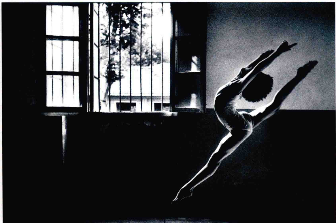
编号: VCG31394007771 1993年7月 | 北京什刹海体校