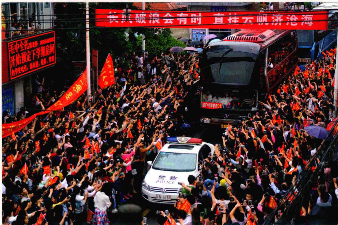
编号: VCG111108219216 2017年6月5日 | 安徽省六安市毛坦厂中学