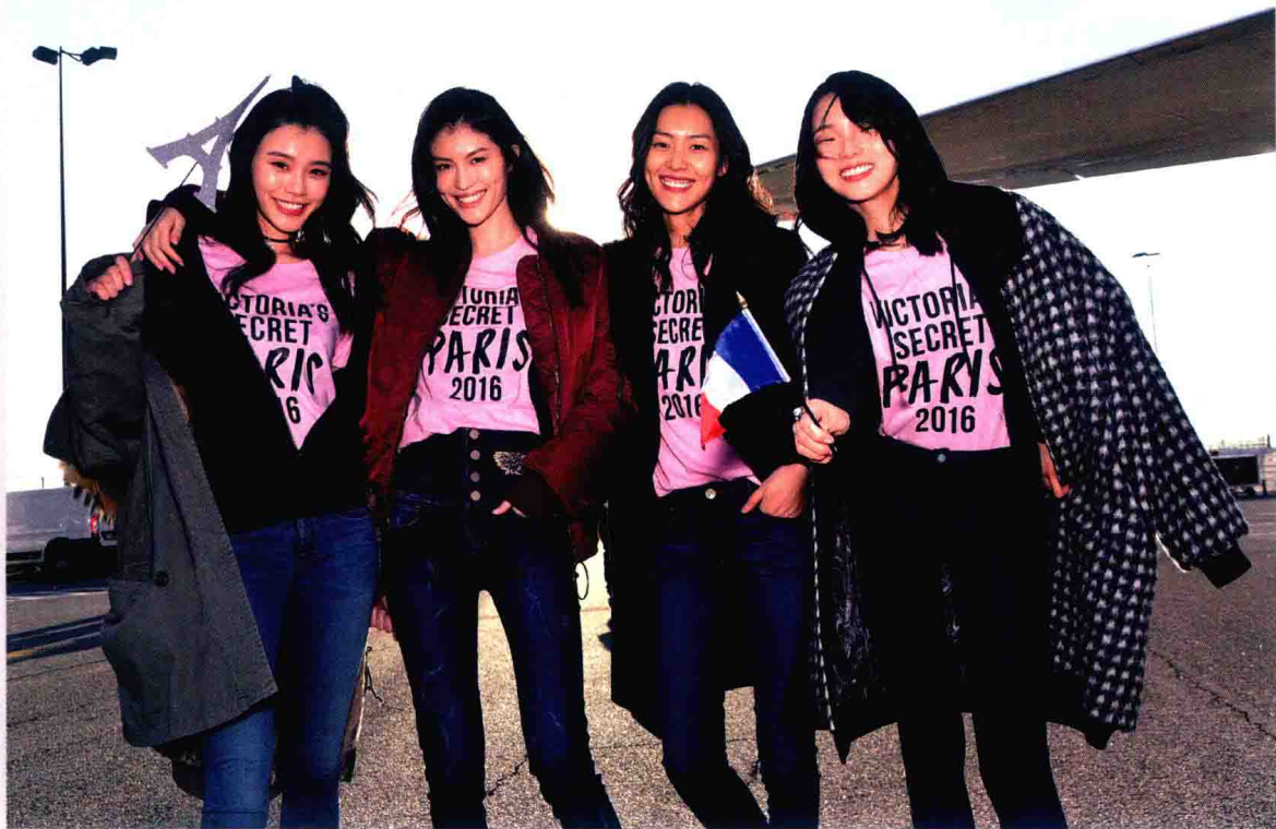
编号: VCG31496193800 2016年11月27日 | 美国纽约