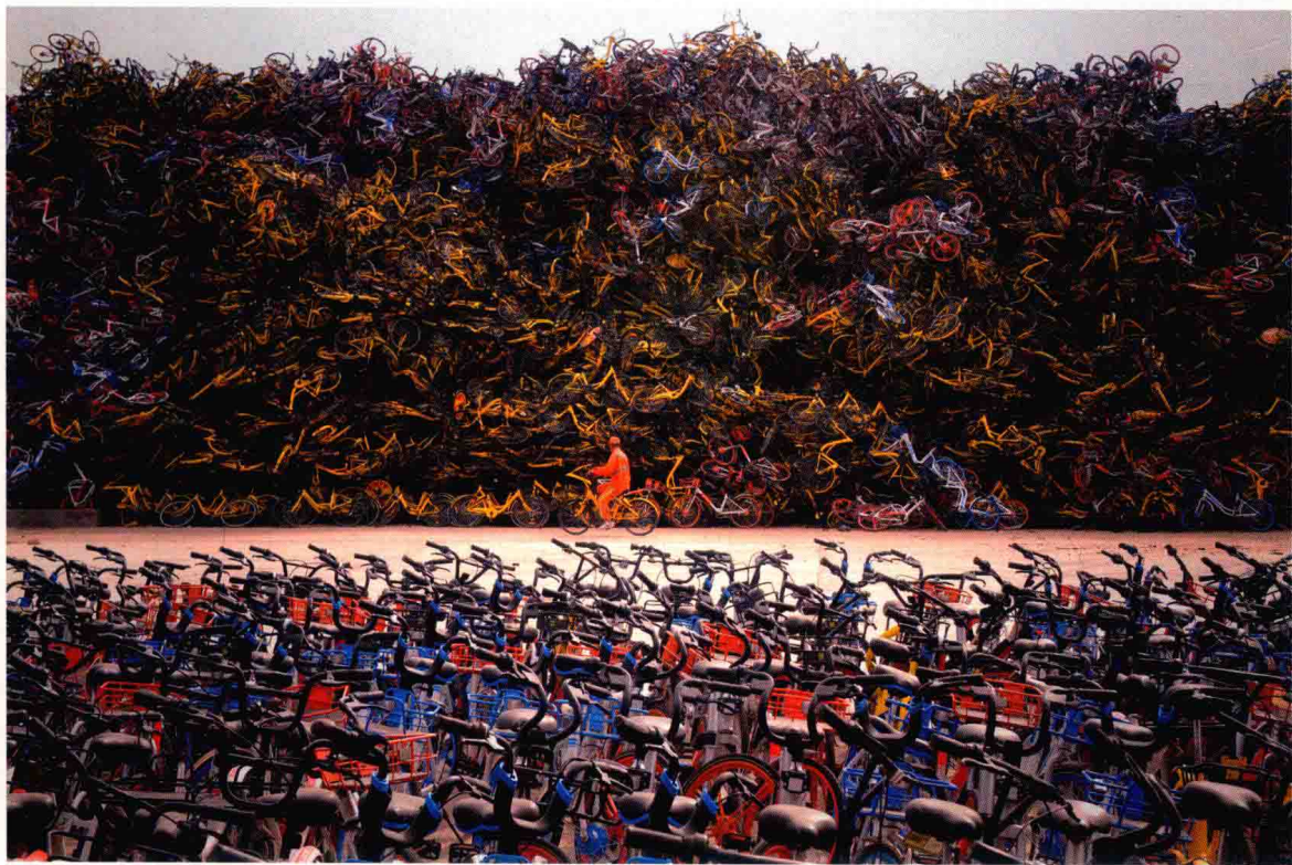
编号: VCG111141856947 2017年12月23日 | 福建厦门