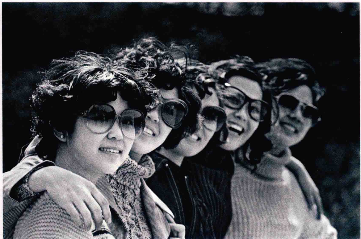
编号: VCG11501103195 1981年 | 北京八大处