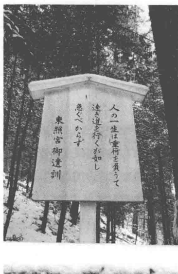
日光东照宫德川家康遗训：“人之一生如负重荷行远道，不可急。”