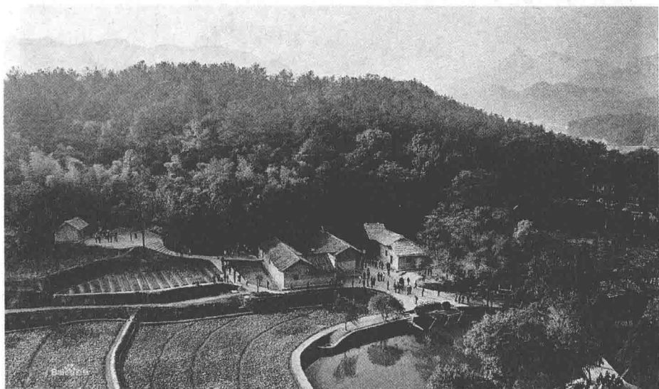
1893年12月26日，毛泽东出生于湖南省湘潭县韶山冲上屋场。图为毛泽东故居。