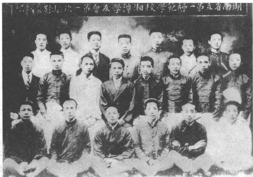
1919年5月，湖南省立第一师范湘潭校友会合影。二排左三为毛泽东，右三为本书作者之父萧道五（业同）。