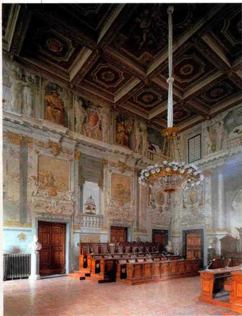
◀ 阿戈斯蒂诺·米泰利和米凯兰杰洛·科隆纳：蓬佩奥厅（局部）。1632 年。罗马。斯帕达宫

一词原有的负面含义得以修正，在词义完全更新后，被用来表达 17 世纪和 18 世纪部分时期具象艺术、建筑和雕塑中形式与色彩的精湛技艺。■