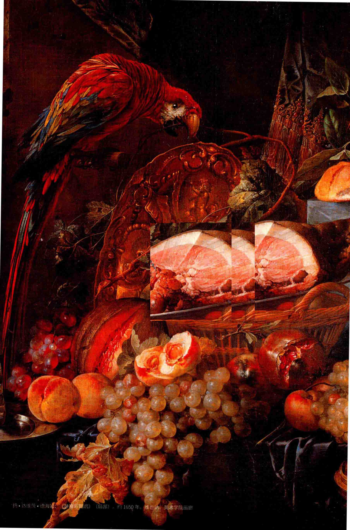
扬·达维茨·德海尼克：《静物与鹦鹉》（局部）。约1650年。维也纳美术学院画廊