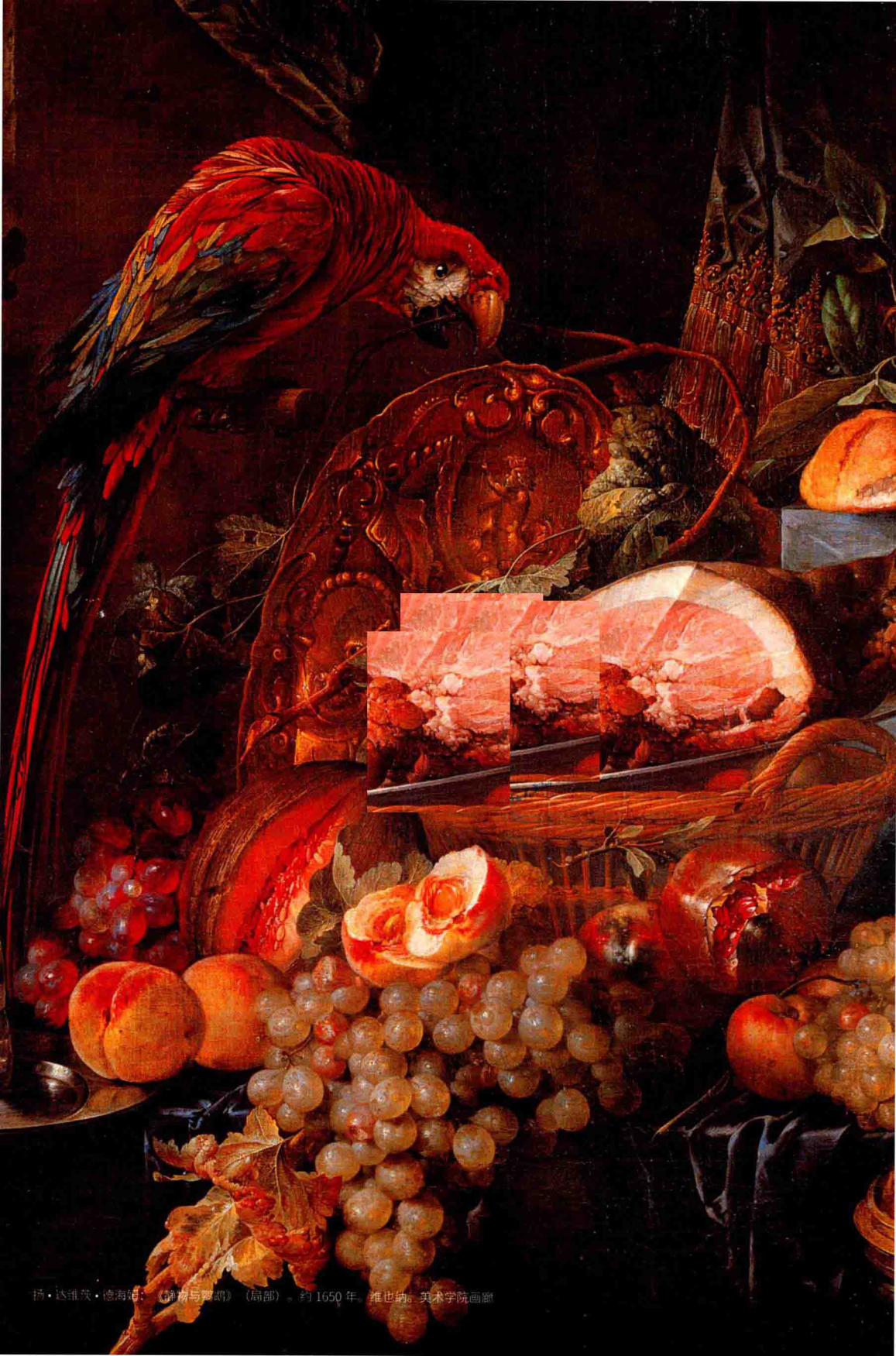
扬·达维茨·德海姆：《静物与鹦鹉》（局部）。约1650年。维也纳美术学院画廊