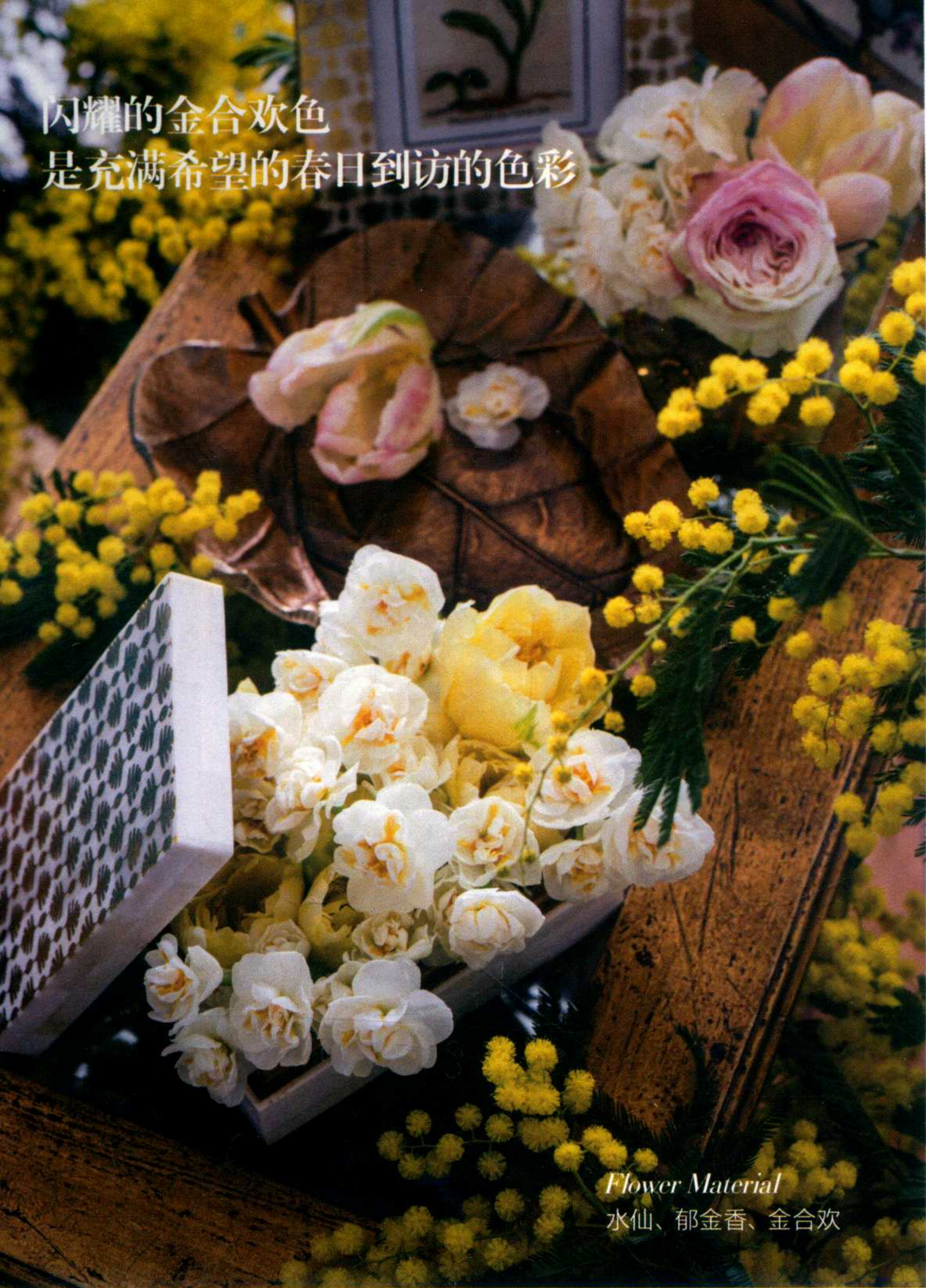
Flower Material 水仙、郁金香、金合欢