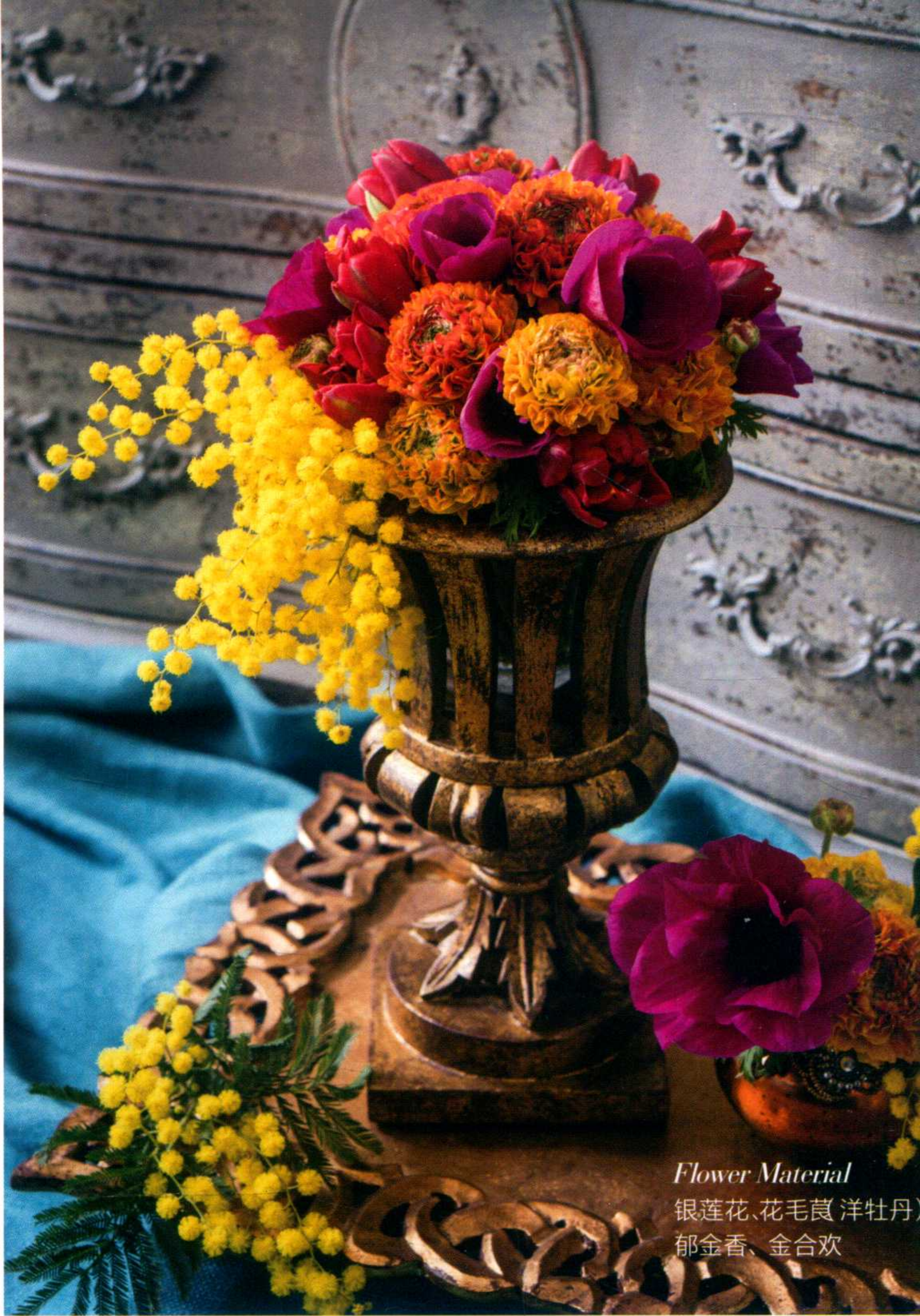
Flower Material 银莲花、花毛茛、洋牡丹、 郁金香、金合欢