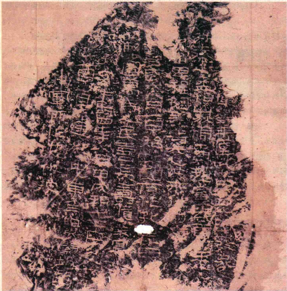
▲ 刻于永寿四年（158年）的汉龟兹左将军刘平国摩崖的拓片

车王齐黎同样认为班超已经撤军，于是放松了警惕，结果在汉军的突袭下只得投降。尤利多收到消息后，只得悻悻退兵。