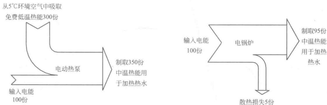
(a) 电动热泵与电锅炉的能流图