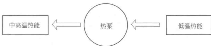
图 1-1 热泵功能示意

热泵的基本特点是只需消耗少量电能或燃气，即可制取大量的中高温热能。以制取 45℃洗浴热水为例，电动热泵与电锅炉、燃气热泵与燃气锅炉的比较如图 1-2 所示。